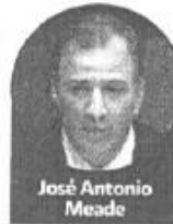
José Antonio Meade