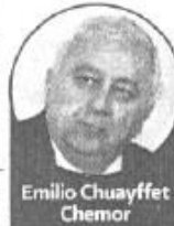
Emilio Chuayffet Chemor