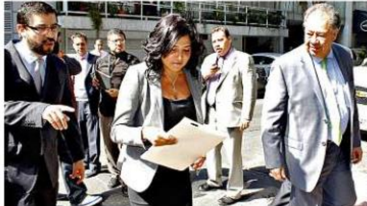
■ La senadora Alejandra Barrales presentó una denuncia en la PGR por irregularidades en el fideicomiso de becas de la ALDF.

“Hacer cualquier comentario sobre la denuncia en la PGR es caer en la cortina de humo de quienes no han sabido explicar ni ofrecer una disculpa