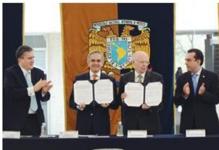
PACTO. El jefe del GDF, Miguel Ángel Mancera, y el rector de la UNAM, José Narro, firmaron convenio de alfabetización.

Mancera sostuvo que esta donación es una “pequeña contribución que hace el GDF” y aclaró que la UNAM tenía la posesión física y el proceso administrativo es legitimarlo jurídicamente.