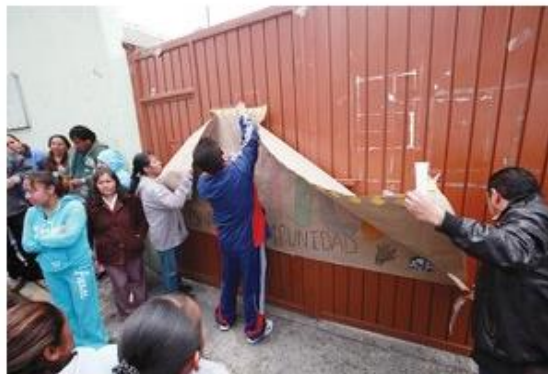
RECLAMO. En la puerta de la primaria "Emiliano Zapata" fue colocado un cartel que decía "Justicia".