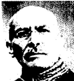
Victoriano Huerta, 40º presidente de México.