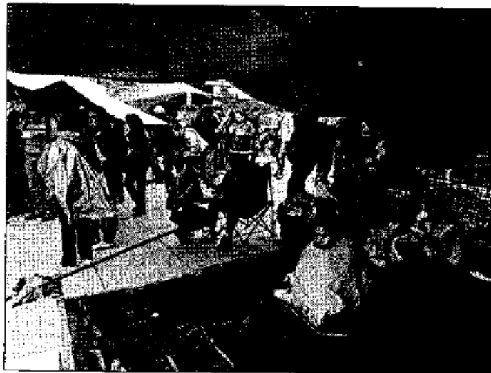
La sección 22 de la Coordinadora Nacional de Trabajadores de la Educación, se mantiene en el plantón en el Monumento a la Revolución.

La fuerza de la Sección 22 es de tal magnitud que ha propiciado problemas financieros. El IEEPO ha visto incrementado su déficit