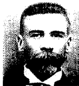
Belisario Domínguez, senador de la República.