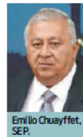
Emilio Chuayffet, SEP.

Estas tecnologías colocarían a México en el Top 5 de consumo de papel reciclado en el mundo.