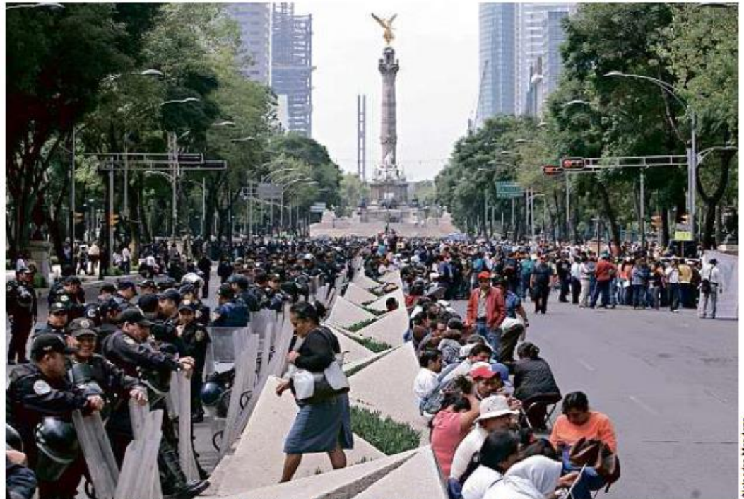
➤ La CNTE se manifestó frente a la Embajada de Estados Unidos, por lo que Reforma fue cerrada cinco horas.