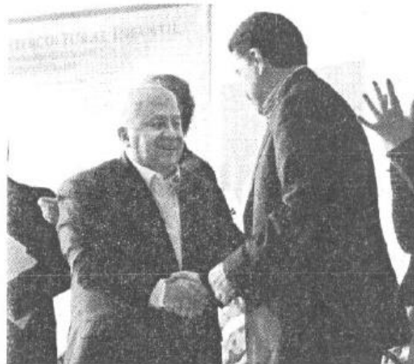
Emilio Chuayffett Chemor, secretario de Educación.

En su oportunidad, José Francisco Olvera Ruíz, gobernador de Hidalgo, enumeró como reto en la entidad la conservación de las raíces culturales existentes en el estado, debido a la migración que se registra hacia otros estados o fuera del país. Por ello se pronunció por fortalecer acciones para revertir ese fenómeno a partir de la educación y la valoración de la interculturalidad en el país.