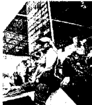
CHIAPAS. Maestros pidieron "cooperación" en una caseta

En al menos seis entidades del país ayer hubo movilizaciones de maestros disidentes y suspensión de clases para protestar en contra de la reforma educativa que impulsa el presidente Enrique Peña Nieto