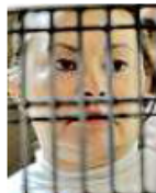
➤ Elba, presa desde febrero

Minutos más tarde, la Procuraduría emitió un comunicado con una dura crítica al Consejo de la Judicatura Federal porque, en su opinión, éste debe revisar la debida actuación de los jueces fe-