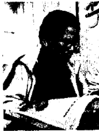
OPORTUNIDAD. Estudiantes presentarán examen único

De acuerdo al Instituto Nacional de Estadística y