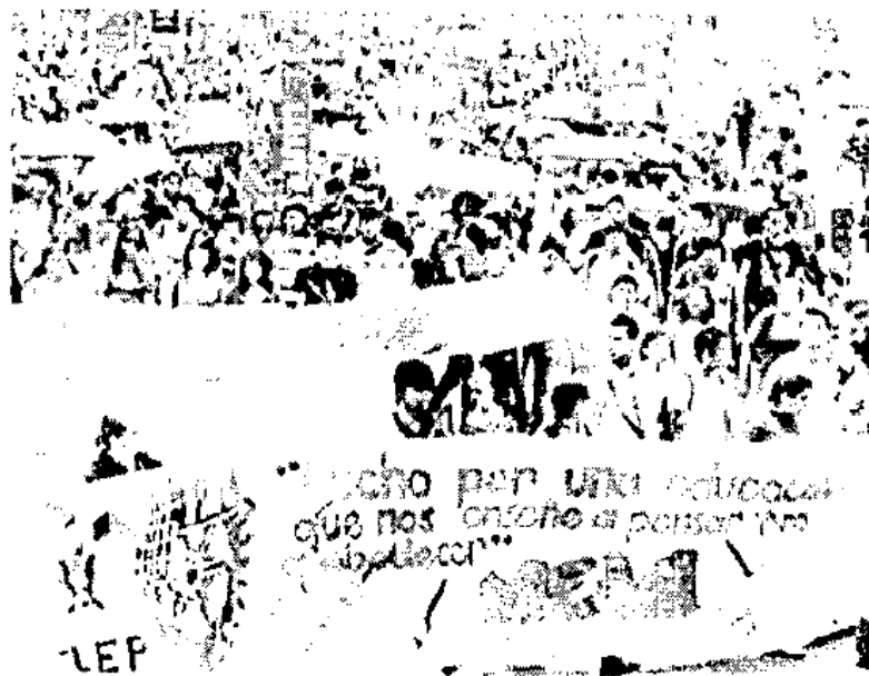
Jóvenes excluidos de la educación superior se concentraron ayer en el Ángel de la Independencia para dirigirse a las oficinas de la SEP

Tras el anuncio, los jóvenes suspendieron el plantón que pretendían iniciar ayer frente a la SEP, así como los que planea-