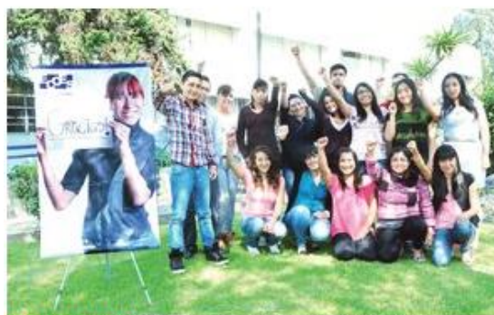
INTERCAMBIO. Estudiantes de licenciatura cursarán un semestre en el extranjero.

Algunas universidades que recibirán a los estudiantes mexicanos son la de Alberta, de Sao Paulo, Central de Chile, de Medellín, de Salamanca, de Tennessee, de Oslo y Estatal de Moscú Lomonosov; la Academia Sibelius; la Escuela Nacional Superior de Arquitectura de París y el King's College London.