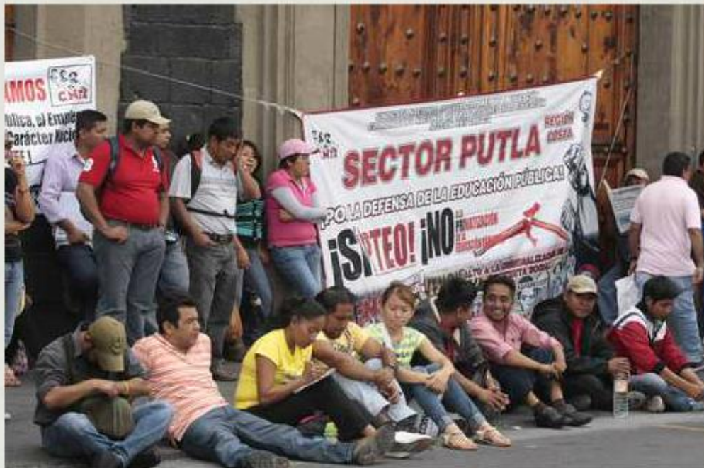
Un contingente de maestros de la Coordinadora Nacional de Trabajadores de la Educación se plantó frente a la Secretaría de Educación Pública, en el Centro Histórico, en demanda de la abrogación de las reformas a los artículos 3 y 73 de la Constitución

asamblea del próximo domingo”, pues puntualizó que se busca la construcción de un plan de acción unitario en el que no sólo participen las entidades con mayor presencia de la coordinadora.