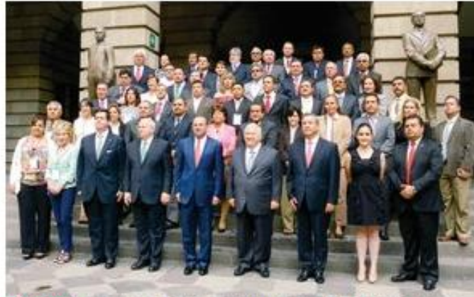
LOGRO. El estado ganó el segundo lugar del Premio a la Vinculación Educación-Empresa; en el acto estuvo Emilio Chuayffet, titular de la SEP. (Foto: )

que la institución educativa, a través del DIF, aplica de manera rápida y eficaz acciones de desarrollo comunitario y forestal en las zonas marginadas de la región.