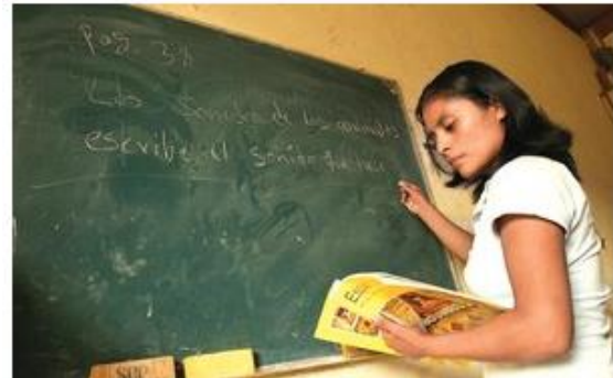
PAGO. Los maestros de Conafe reciben salarios de mil 800 pesos al mes.

El Consejo Nacional de Fomento Educativo (Conafe) necesita una "política de revisión salarial", debido a que los maestros que atienden a los 7.3 millones de niños y adolescentes que están en las 63 mil zonas más pobres y alejadas del país reciben salarios mensuales de mil 800 pesos, esto es, la mitad de lo que ganan los instructores de la educación para los adultos y hasta cuatro veces menos que los de Conalep.