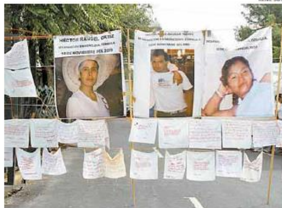
Estos días el paso en Bucarell está cerrado por una protesta.

Un evento similar ocurrió el 10 de junio, cuando luego de la marcha que recordó el denominado halconazo al llegar al Zócalo capitalino, personas embozadas agredieron a elementos de la corporación policiaca e incluso retuvieron, golpearon y robaron a funcionarios del GDF.