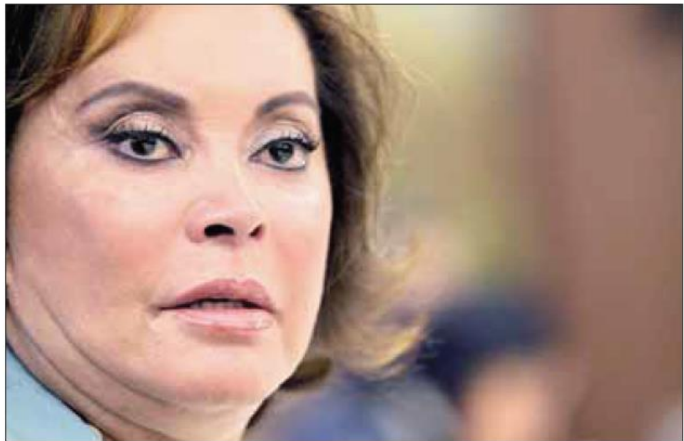
“A Santa Martha no quiero volver, es horrible”, ha dicho la huésped frecuente de la torre médica. En la imagen, la ex lideresa durante una conferencia de prensa ofrecida el 29 de junio de 2011

Cuenta con una pequeña celda y un baño privado; la detención no ha logrado amainar las rencillas entre sus dos hijas