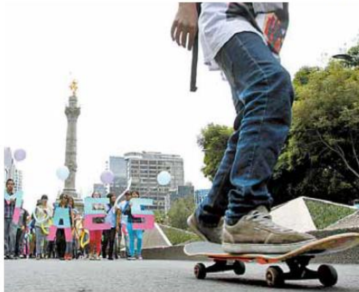
Ayer, los integrantes del MAES realizaron la "Rodada por la Educación".