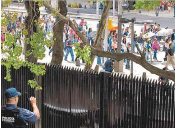
Los profesores bloquearon Paseo de la Reforma.