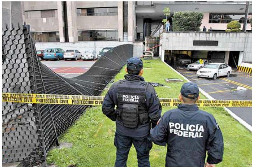
En el recinto de San Lázaro fue reforzada la seguridad.

En conferencia de prensa, el legislador confirmó la presentación de una denuncia penal por esos hechos ante el Ministerio Público Federal y emplazó a la Mesa Directiva a reforzar las acciones de vigilancia y seguridad en el recinto para impedir que “acontecimientos delincuenciales”