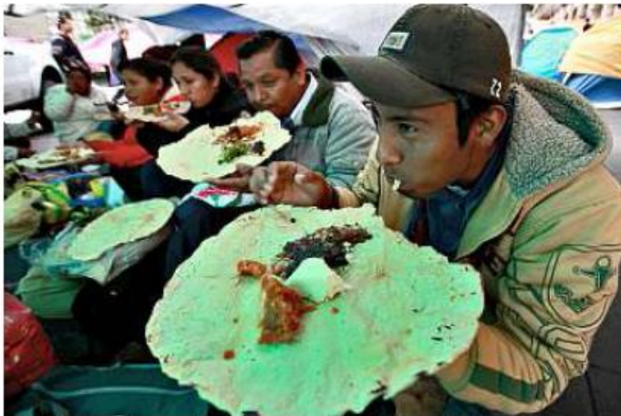
> El plantón y las movilizaciones seguirán al menos hasta el 15 de septiembre, según algunos dirigentes.

“Los diputados nos volvieron a jugar con engaños y la Coordinadora lo ve como una falta de respeto”, apuntó.