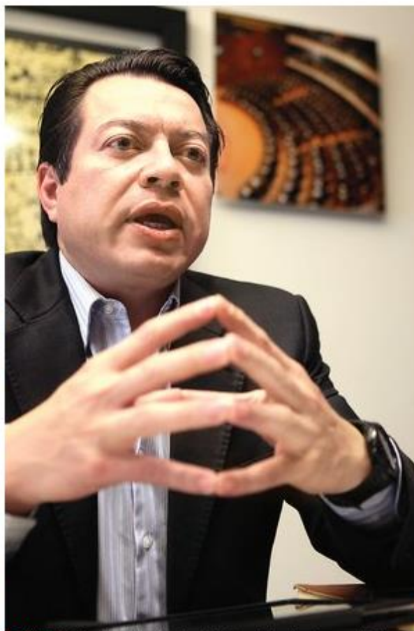
CRÍTICA. Mario Delgado, legislador del sol azteca.

Confirmó que el titular de Gobernación, Miguel Ángel Osorio Chong, les informó que las leyes secundarias fueron avaladas por su el PRI en el Pacto por México, y por el PRD, lo cual criticó.