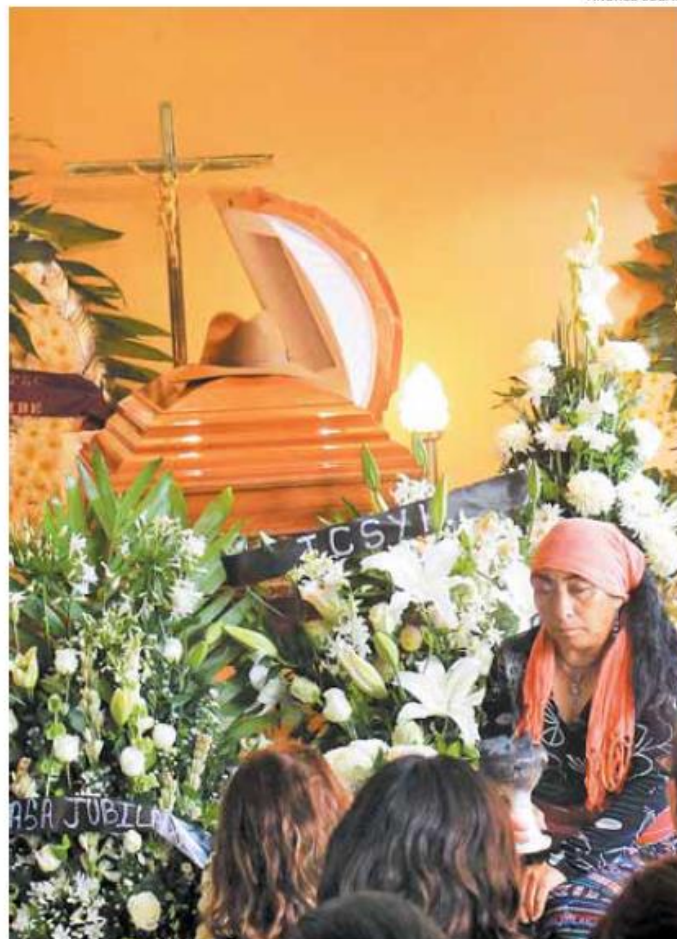
El ex funcionario universitario será sepultado hoy en Puebla.