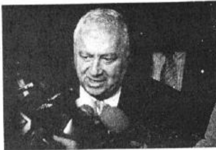
Emilio Chuayffet.