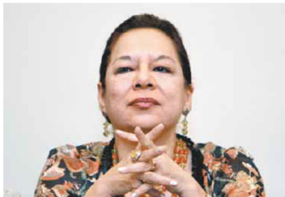
Su primera gestión fue de 1992 al 2000.