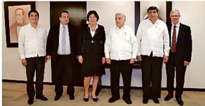
Previo al evento, el gobernador Arturo Núñez Jiménez dialogó con la embajadora francesa, así como con el rector de la UJAT.