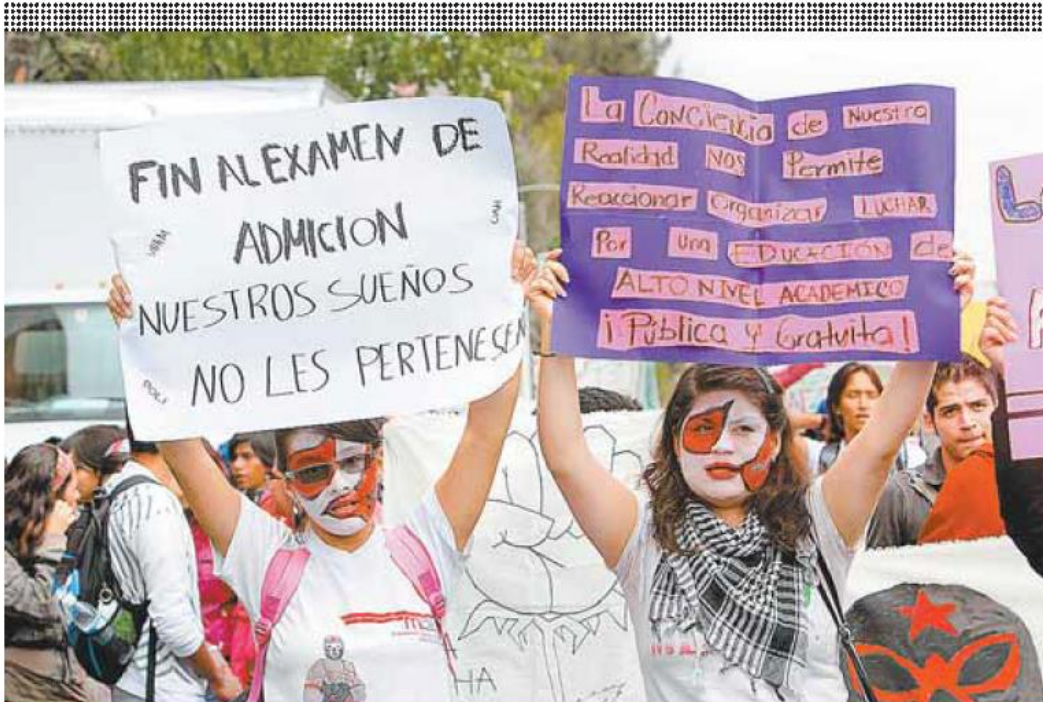
MENSAJE INEQUÍVOCO. Unos 100 jóvenes marcharon en la calzada México-Tacuba rumbo a la SEP en demanda de más lugares en las universidades públicas, luego de fracasar en el examen correspondiente.