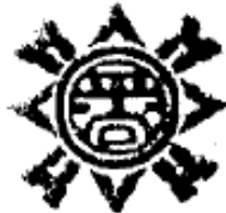
Delegación Sindical D-II-IA-1