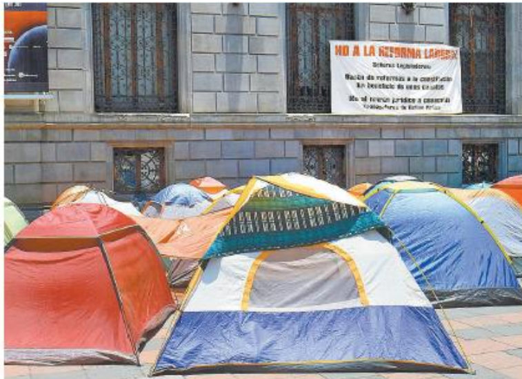
Los inconformes se mantienen en la Plaza Tolsá, a escasas cuadras de la Plaza de la Constitución.

“Pedimos que el espacio del Zócalo no sea ocupado por ningún grupo, si lo van a tomar o lo quieren tomar mediante la fuerza y no mediante una concertación