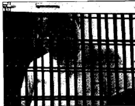
» LA EXLIDERESA magisterial, Elba Esther Gordillo Morales.

Hace unos días se dio a conocer que la maestra gastaba de 7 a 15 millones de pesos mensuales y los recursos, por lo general, provenían de cheques firmados por el actual líder magisterial,