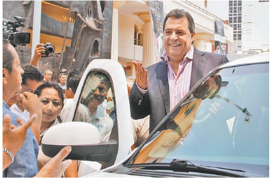
Estuvo en la remodelación de la plaza cívica Primer Congreso de Anáhuac en Chilpancingo.

Afortunadamente, en la región de la Costa Chica ocurrió lo mismo", dijo.