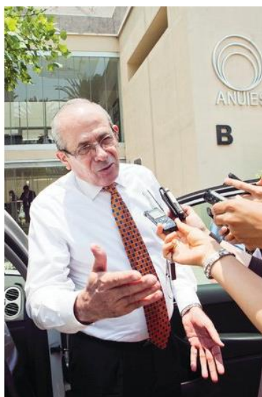
NOMBRAMIENTO. Enrique Fernández, rector de la UAM.

Al salir de la reunión, indicó que "en los próximos años la ANUIES deberá mantener su papel de interlocutor ante el Estado mexicano para mejorar la calidad de la educación superior".