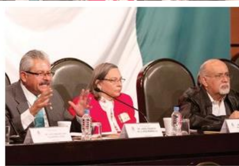
ENCUENTRO. Diputados de siete bancadas se reunieron con representantes del INEE.

Ayer, por separado, las dos mesas de redacción de las leyes secundarias en materia educativa sesionaron en el Senado y en la Cámara de Diputados, donde recibieron la retroalimentación de los integrantes del INEE, instancia que evaluará el sistema educativo del país, especialmente la preparación profesional de los docentes.