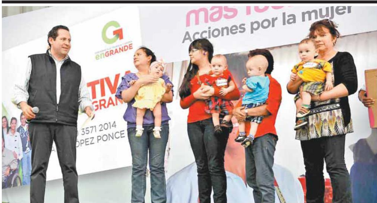
La Paz, México.- Al llevar a cabo una gira regional de trabajo por la zona oriente de la entidad, en conjunto con todo su gabinete, el gobernador Eruviel Ávila Villegas entregó 700 equipos de laboratorios de ciencias a escuelas secundarias, para la enseñanza de energías renovables y tecnologías futuras. Acompañado del gabinete estatal, también estuvo en el municipio de Chicoloapan, donde anunció la construcción de un hospital en este municipio, una institución de nivel medio superior del Instituto Politécnico Nacional (IPN), así como una Central de Abasto, en un evento donde otorgó diversos estímulos a mujeres y afirmó que su gobierno trabaja para lograr mejores condiciones de vida en el oriente del estado y la infraestructura necesaria para atraer más