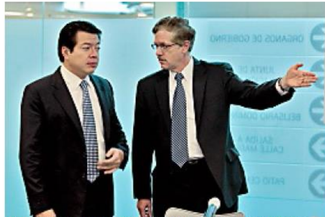
► Los senadores Mario Delgado y Juan Carlos Romero participaron en una reunión con miembros de la Junta de Gobierno del INEE.

Con esta reunión, la Comisión Redactora de la Ley del INEE arrancó los trabajos de consulta