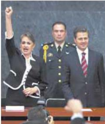
La directora del Poli y el Ejecutivo.