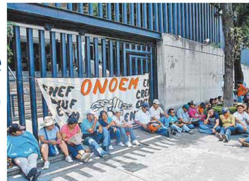
Los maestros se manifestaron en las sedes de PRI, PAN y PRD del DF.