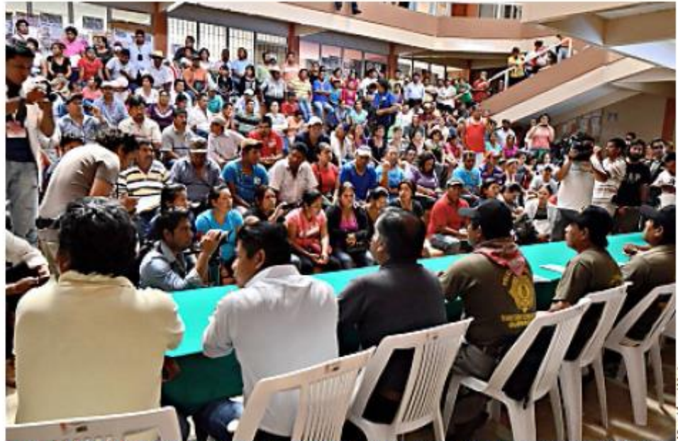
SOLIDARIDAD. Policías comunitarios acudieron a la asamblea de la Ceteg para sumarse a su plan de protestas que llevarán a cabo los maestros en los próximos días en Guerrero.

En este punto, los maestros, señalaron que existen las condiciones para solicitar al Congre-