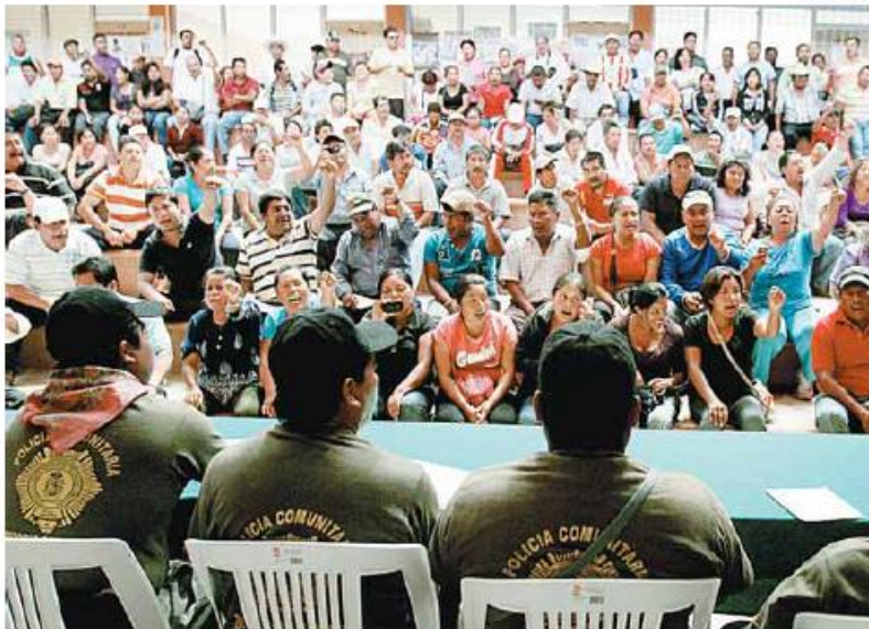
A la reunión de los inconformes acudieron comandantes de la CRAC uniformados, pero sin armas.