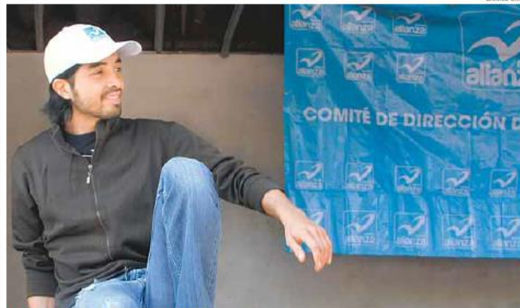
Confía en la inocencia de la ex líderesa magisterial.