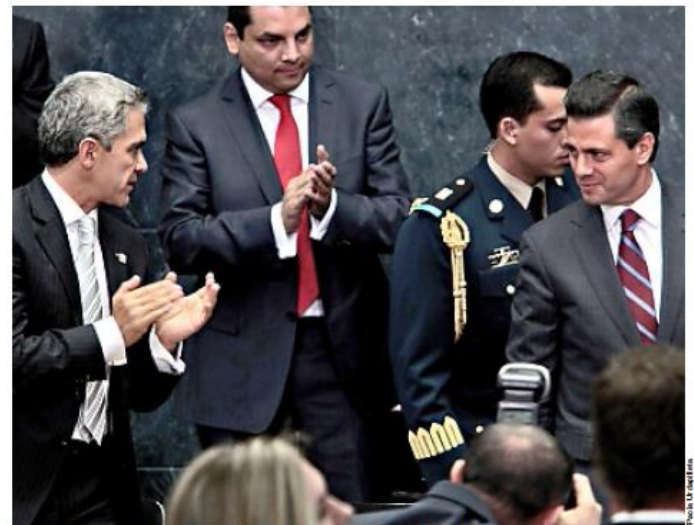
► El Jefe de Gobierno del DF, Miguel Ángel Mancera, y el Mandatario Enrique Peña Nieto, durante el cambio de presidente del Consejo de la Comunicación