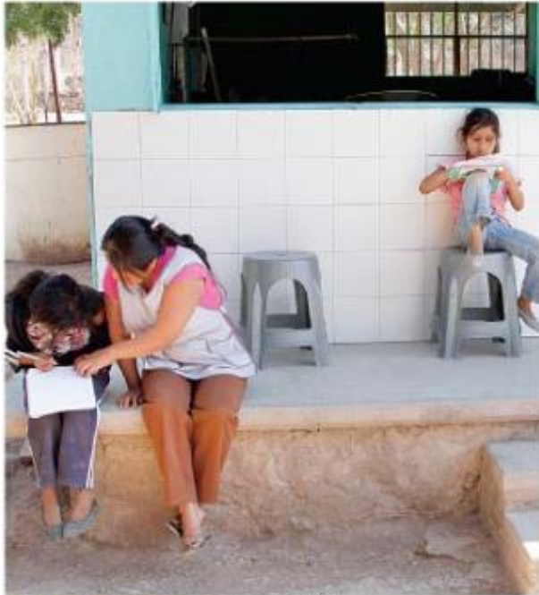
ESCASOS RECURSOS, otra causa.

Superar el rezago, el reto, dijeron en el Encuentro Nacional Hacia una Política de Educación Comunitaria.