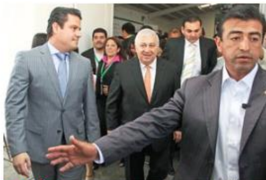
POSICIÓN. Emilio Chuayffet, secretario de Educación Pública, al salir del Foro de Consulta de Educación Normal.

Luego de participar en la ceremonia de apertura del Foro de Consulta de Educación Normal, para integrar el Plan Nacional de Desarrollo 2013-2018, realizada en la Escuela Normal de Jalisco, el titular de la SEP dijo a EL UNIVERSAL que entre la serie de rumores, "absolutamente inadecuados" que se han señalado está "que las normales van a desaparecer. No, las tenemos que fortalecer. Hay una tradición normalista en México... Yo creo que las normales son las grandes escuelas que han educado a los maestros de México".