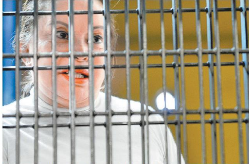
La PGR acusó a La Maestra de lavado de más de 2 mil 600 millones de pesos.

Mientras tanto, personas cercanas a la defensa de Elba Esther informaron que este miércoles está programada una audiencia