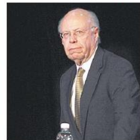
Ofreció conferencia en Universum.

“ No responderemos a la provocación, actuando con violencia. Defenderemos la UNAM sin caer en provocaciones”