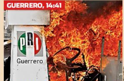
> Los maestros irrumpieron en la sede del PRI en Chilpancingo, donde causaron destrozos y quemaron muebles.