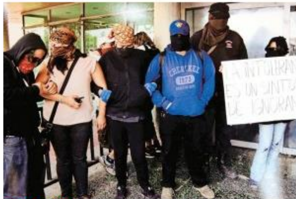
ESTRATEGIA. Según expertos, los radios que usan activistas tienen un alcance de aproximadamente 3 kilómetros a la redonda.

En las imágenes publicadas a lo largo de los días que ha estado tomada la Torre de Rectoría, se puede visualizar cómo constantemente los encapuchados utilizan los radiocomunicadores.