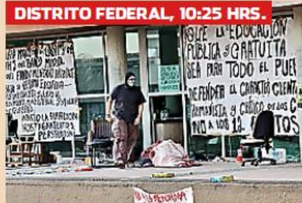
> Los encapuchados decidieron mantener la ocupación de la Rectoría e incluso reforzaron anoche su campamento.