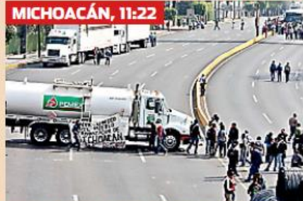
> Los normalistas secuestraron 14 camiones, entre ellos 2 pipas, para bloquear los accesos a Morelia.