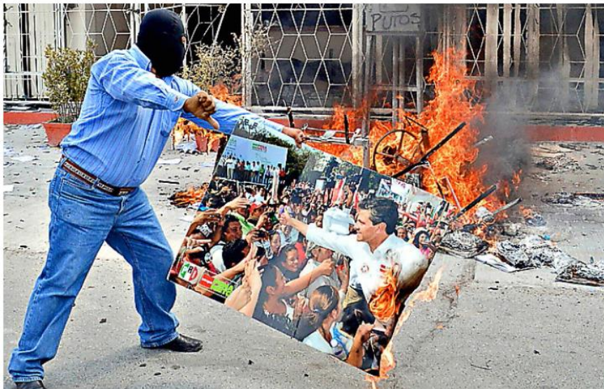
IRRUPCIÓN. Integrantes del Movimiento Popular Guerrerense irrumpieron en las instalaciones de la Contraloría de la Secretaría de Educación estatal, donde causaron destrozos y quemaron el mobiliario.

“En esta quincena ya se van a aplicar los descuentos quienes no laboraron”, aseguró el funcionario estatal.