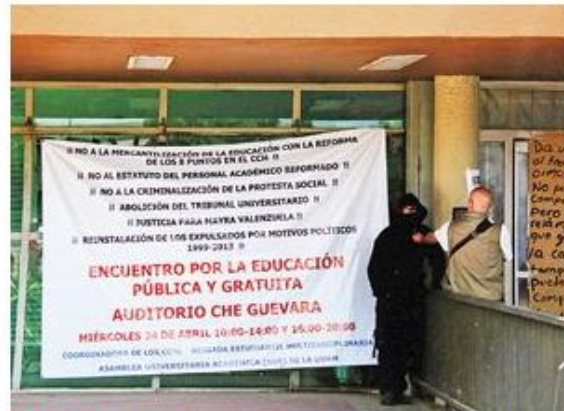
GUARIDA. El auditorio "Justo Sierra", renombrado como "Che Guevara", es reduto de movimientos radicales al interior de la UNAM.

Las autoridades universitarias entregaron a la PGR videos y documentación, entre los que destaca información sobre la identidad de algunos de los supuestos alumnos que tomaron la Torre de Rectoría la semana pasada, como evidencias para que el Ministerio Público (MP) de la Federación proceda penalmente en contra de los activistas por la posible comisión de delitos.