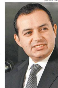
El presidente del Senado.

real sentenció que la reforma educativa carece de legitimidad y añadió que los maestros no fueron escuchados.