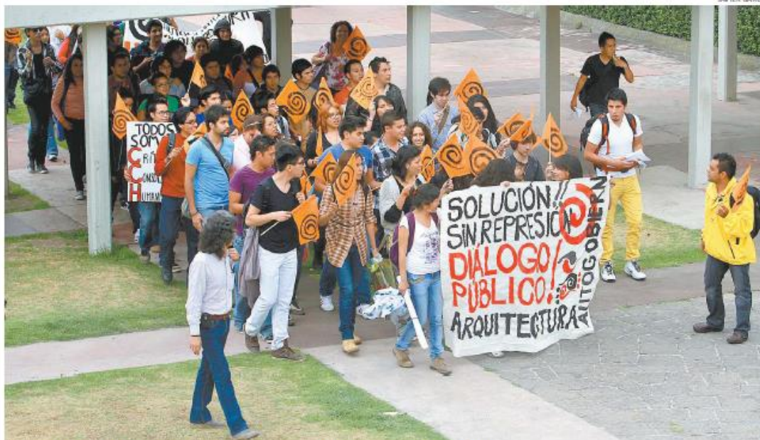
Alumnos de la Facultad de Arquitectura encabezaron una manifestación a favor de los embozados.

El derecho a la inconformidad termina cuando se cometen "infracciones o delitos": CDHDF; pide el ombudsman capitalino un "desalojo limpio"