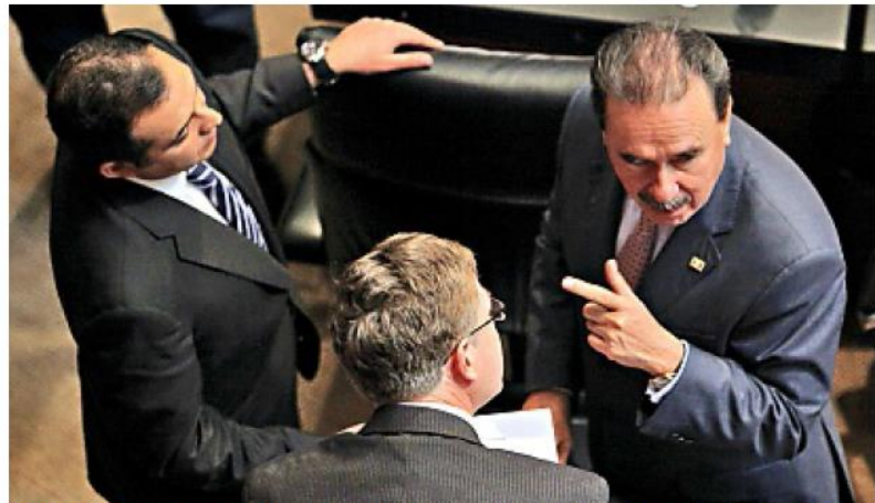
ACUERDO. En el Senado, Ernesto Cordero y Emilio Gamboa, discuten con Juan Carlos Romero Hicks, previo a la elección de la Junta de Gobierno del Instituto Nacional de Evaluación Educativa.

“Se necesita trabajar en las normas para darle una estructura formal definitiva al INEE”, expresó el especialista.