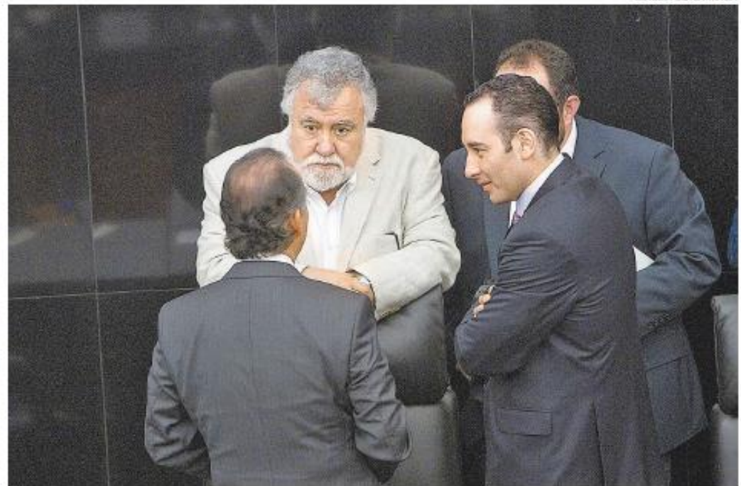
Raúl Cervantes, de espaldas, Alejandro Encinas y Roberto Gil.

Estudió la licenciatura en Ciencias de la Educación en la Univer-