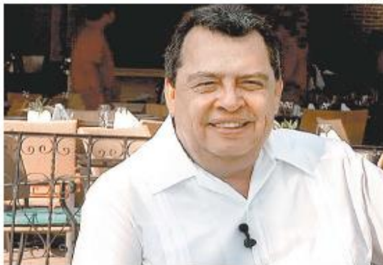
Acusa a movimientos sociales de otras entidades.

“Hay elementos que nos permiten confirmar que sí hay fuerzas externas al movimiento magisterial, que por supuesto que le están aportando financiamiento”.