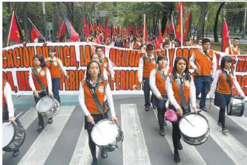
Ayer hubo una marcha en apoyo a la CETEG en la Ciudad de México.

“Puede ser que el movimiento lo mantengan una semana o tres días, pero no durante más de 50 días, dándoles desayuno y comida”, sentencia