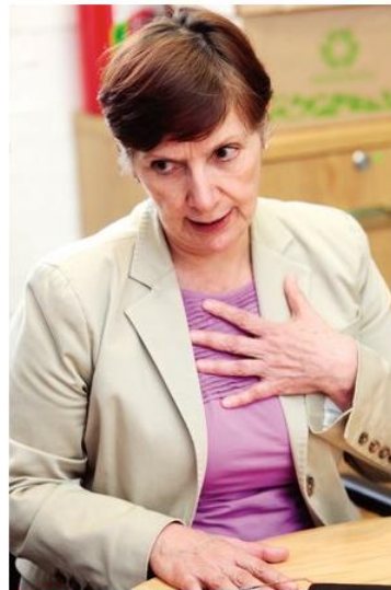
TÍTULO. Licenciada en Química Bacterióloga Parasitóloga.