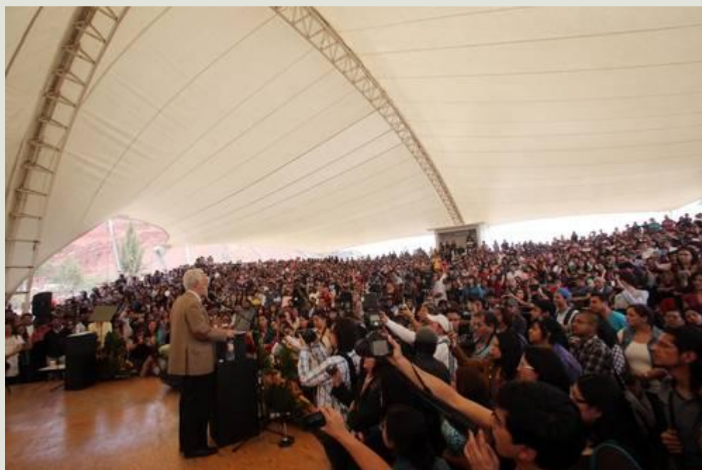
Enrique Dussel, rector interino de la UACM, inauguró el semestre 2013-1 en el plantel San Lorenzo Tezonco

Ofrece a los opositores a su gestión que no va a ser tocado un solo pelo de sus derechos