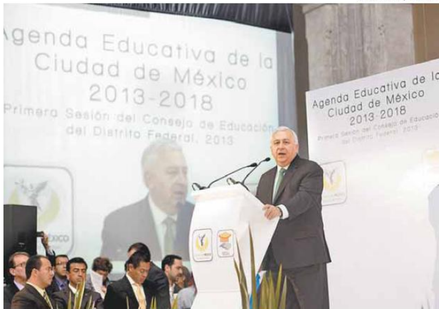
El funcionario señaló que la SEP analiza los planteamientos sindicales.

Descarta que influyera la detención de Gordillo