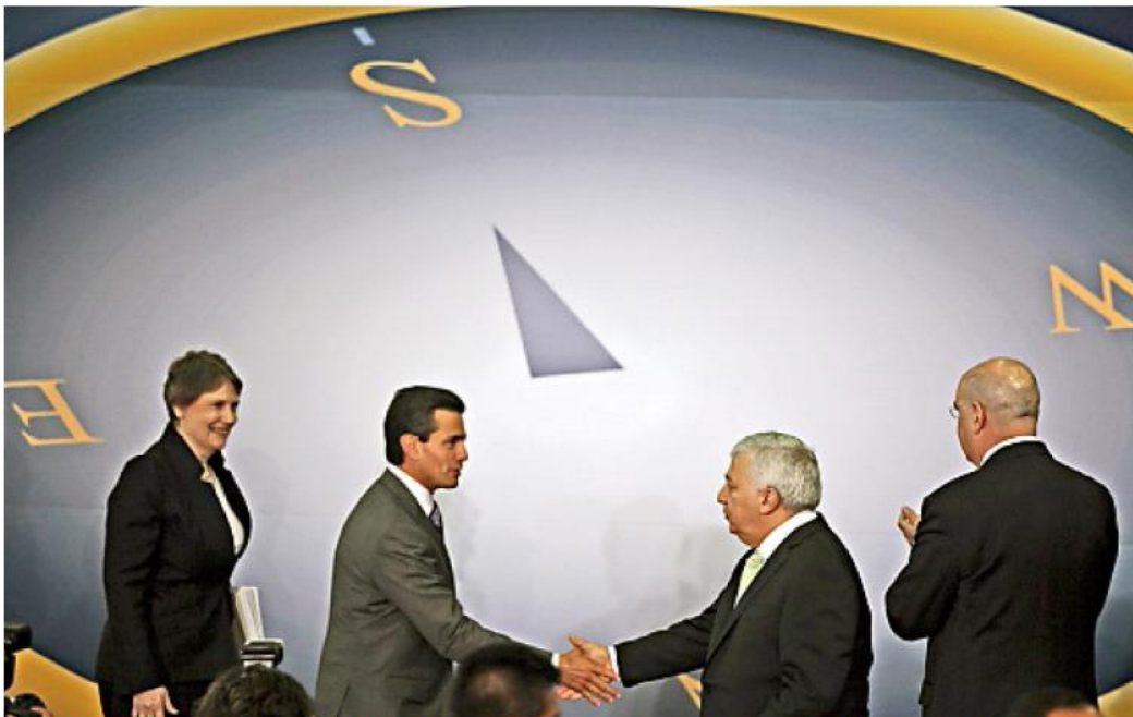
CORTE DE CAJA. Helen Clark, Administradora del PNUD, acompañó al Presidente Enrique Peña Nieto durante la presentación del Informe sobre Desarrollo Humano 2013. También asistieron los Secretarios Emilio Chuayffet y Juan José Guerra.

Minutos antes, Helen Clark advirtió que el crecimiento económico no se traduce en sí mismo en avances en el desarrollo humano porque implica inversiones en la capacitación laboral, nutrición, salud y educación, así como adoptar políticas pragmáticas que enfatizan la creación de puestos de trabajo, la integración gradual a los mercados mundiales y la mejora continua en la calidad de los servicios.