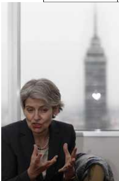
“Sin educación no se puede alcanzar la inclusión y la movilidad social”, advirtió Irina Bokova.

Frente al contexto de violencia que enfrenta nuestro país, y afecta a miles de jóvenes, la directora general de la Unesco, también señaló que es necesario dar una perspectiva de desarrollo a las nuevas generaciones.