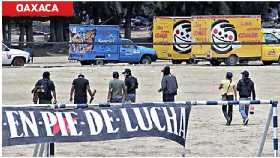
> Normalistas de Oaxaca retuvieron más unidades de transporte como medida de presión para que el Gobierno estatal les asigne plazas de manera automática.

Maestros de ambas secciones han realizado marchas y paro de actividades en días laborales. El más reciente fue un paro de 48 horas la semana pasada.