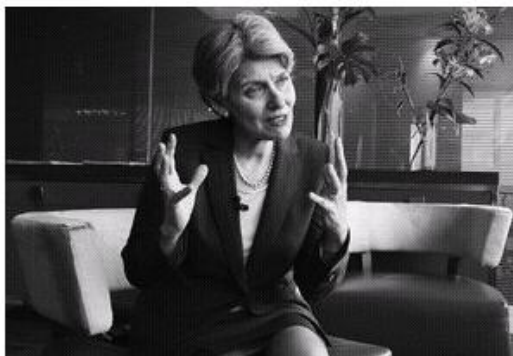
RESPALDO. Irina Bokova, directora general de la Unesco.