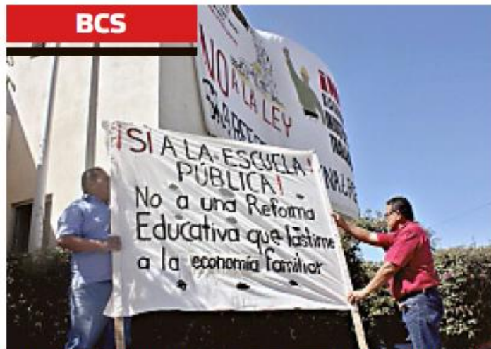
> Maestros del Comité Democrático de la sección 3 del SNTE iniciaron un paro en escuelas primarias y de preescolar de Baja California Sur.