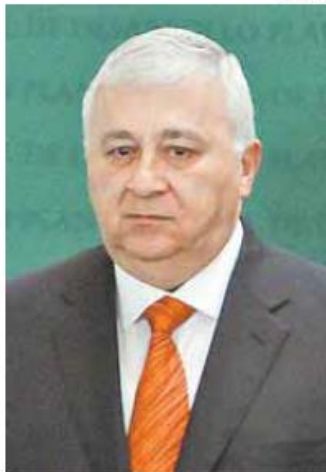
El secretario de Educación.

"Vamos a prohibir por ley las cuotas obligatorias; vamos a impedir que las cuotas sirvan para condicionar inscripción, igualdad en la recep-