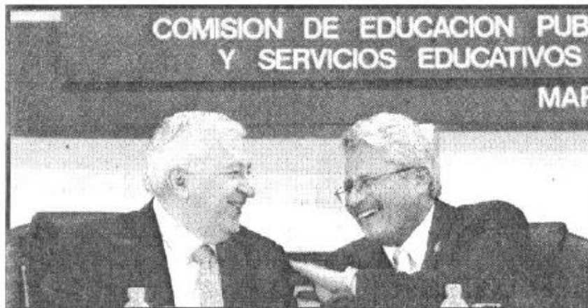
Emilio Chuayffet Chemor, titular de la SEP, se reunió con diputados.

Por lo que se refiere a las cuotas obligatorias, insistió en que van a ser expresamente prohibidas, para evitar que sean utilizadas para condicionar inscripción.