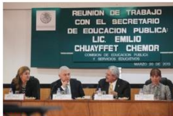
REUNIÓN. Emilio Chuayffet delineó ante diputados el proyecto de legislación secundaria de la reforma educativa.

Por lo que toca a las cinco temas para integrar el órgano conductor del Instituto Nacional de Evaluación Educativa, Chuayffet dijo que entregará al Senado las propuestas oficiales, antes del 26 de abril próximo.