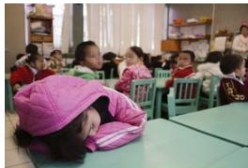
ABUSO. Padres de los niños aseguran que algunos menores han sido tocados en sus genitales por un alumno.

El presidente de la mesa directiva agregó que el DIF ya tiene conocimiento del caso y aseguró que el objetivo de los padres es que tanto el menoragresor como los niños agredidos reciban atención. "No queremos más agresiones", expresó.