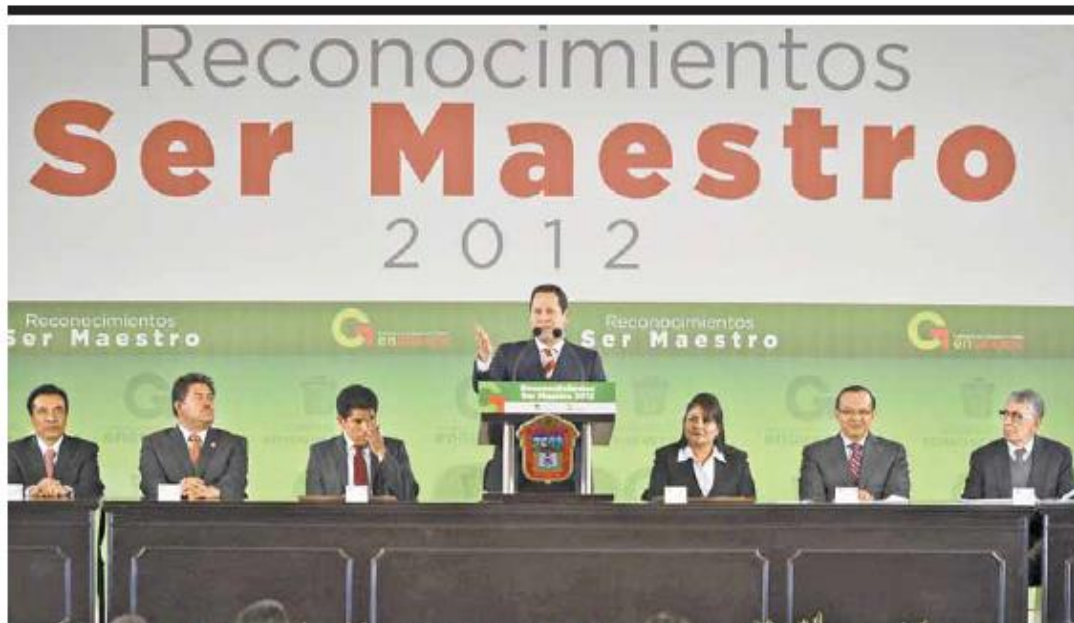
Toluca, México.- Acompañado del secretario general del Sindicato de Maestros al Servicio del Estado de México (SMSEM), Héctor Ulises Castro Gonzaga, y del secretario de Educación de la entidad, Raymundo Martínez Carbajal, el gobernador Eruviel Ávila Villegas entregó 56 millones de pesos en reconocimientos y estímulos "Ser Maestro 2012", a 2 mil 800 docentes de nivel básico del subsistema estatal y señaló que este reconocimiento es prueba de gratitud de los mexiquenses, así como un estímulo para que los profesores continúen preparándose, por lo que destacó algunas de las acciones realizadas en este rubro, en materia de infraestructura, apoyos y calidad, como lo son la construcción y remodelación de más de 4 mil espacios de preescolar, 43 de primaria y 27 de secundarias.