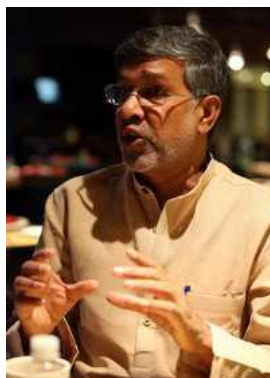
Kailash Satyarthi en entrevista con La Jornada

Satyarthi, quien ha dedicado la mitad de su vida a ayudar a los millones de niños indios esclavizados por empresarios y terratenientes, refiere también que, además de la falta de educación de calidad, los menos favorecidos deben enfrentar políticas públicas que facilitan la mala e injusta distribución de la riqueza; no es la pobreza la que perpetua el trabajo infantil, sino éste el que perpetua la pobreza, asegura. Asimismo, recuerda que sólo en México se encuentran 11 de las familias más acaudaladas, incluido uno de los hombres más ricos del orbe.