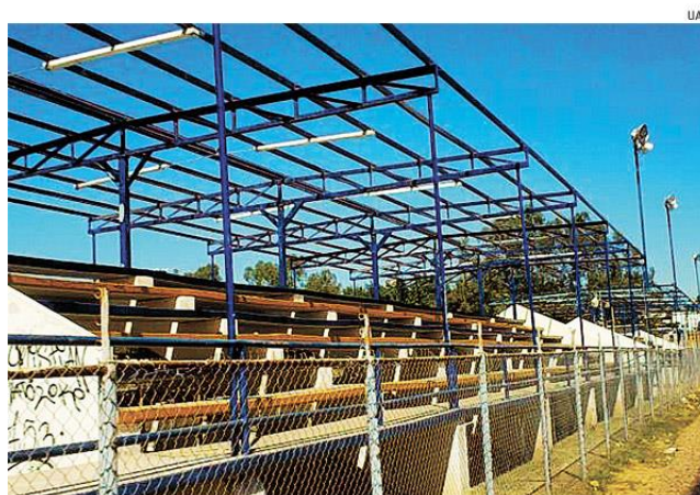
La institución tiene altas expectativas para sus participantes en diversas categorías deportivas. deportivas.

El esfuerzo por recibir a todos los atletas que participarán en la próxima Universiada Nacional, implica grandes esfuerzos en infraestructura e inversión deportiva. Es por ello que la Universidad Autónoma de Sinaloa (UAS), que recibirá a más de 6 mil deportistas de 312 instituciones de educación superior de nuestro país del 22 de abril al 6 de mayo, marcha a grandes pasos para estar a la altura de tan importante evento.