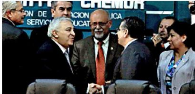
► Emilio Chuayffet, titular de la SEP (izq.), sostuvo una reunión de trabajo con diputados de la Comisión de Educación.

Adelantó que este año se fortalecerán las 6 mil escuelas de tiempo completo que ya existen, y que el número de planteles de ese tipo pasará a 8 mil.