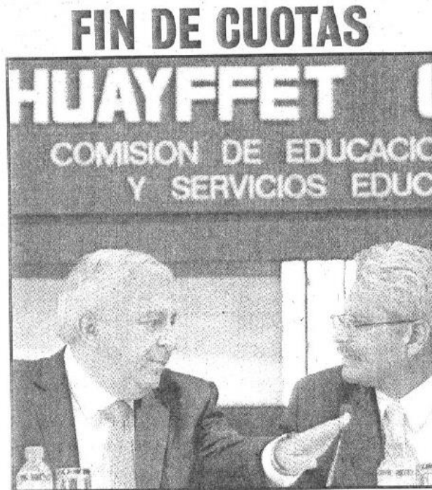
Emilio Chuayffet, secretario de Educación Pública, advirtió que por ley se acabarán las cuotas de inscripción en escuelas públicas.