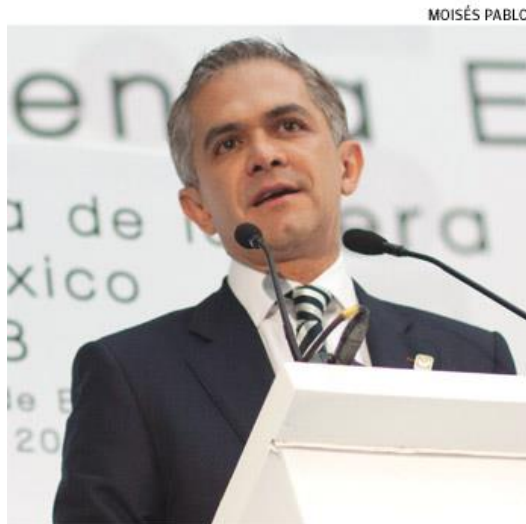
Miguel Ángel Mancera, Jefe de Gobierno del Distrito Federal.