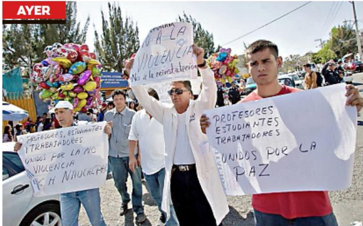
► Trabajadores, maestros y estudiantes del CCH Naucalpan realizaron una pequeña marcha para exigir que se aplique la ley por desmanes en ese plantel.

El conflicto que enfrenta los CCH se agudizó por hechos del el 1 y 5 de febrero.