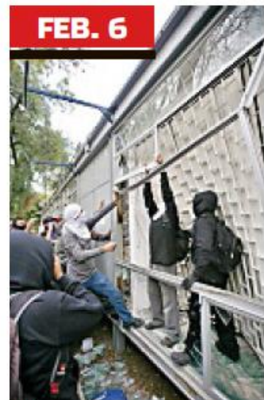
► Tras una marcha, un grupo de encapuchados tomó la sede de los CCH.