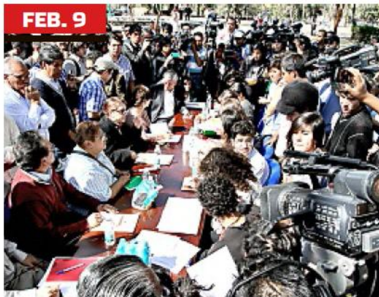
► Fue el primer día negociaciones entre inconformes y autoridades del Colegio de Ciencias y Humanidades.