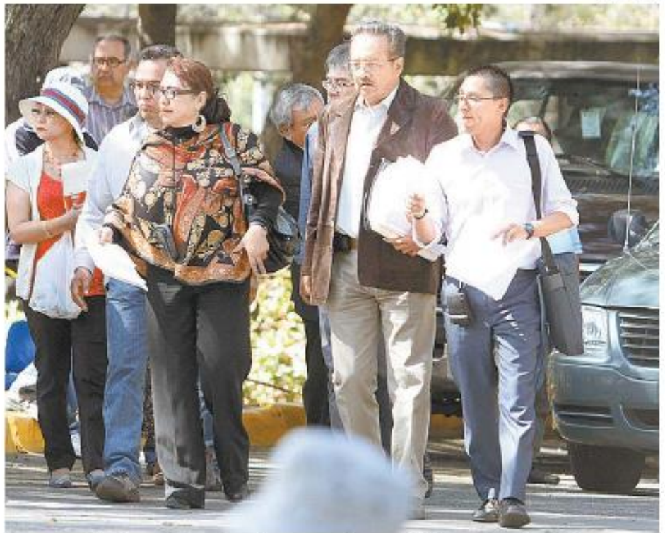
La autoridades universitarias se retiraron de la mesa de diálogo.

Se informó que el consejo no ha creado ninguna "Comisión Substanciadora" y mucho menos ha iniciado algún proceso contra la rectora o cualquier otra autoridad de la UACM. M