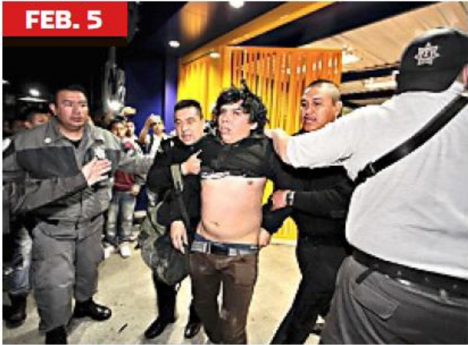
> Un grupo de jóvenes agredió a estudiantes que estaban en una asamblea en Naucalpan. La Policía del Edomex detuvo a 10 de los rijosos.