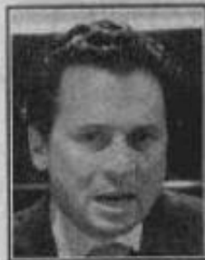
EMILIO LOZOYA AUSTIN