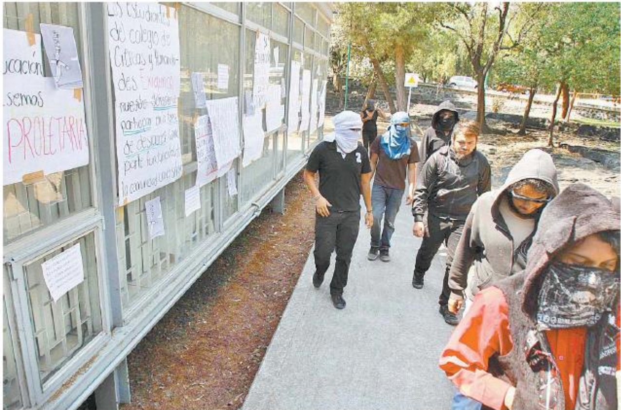
Estudiantes encapuchados anunciaron que realizarán una marcha el próximo 28 de febrero.