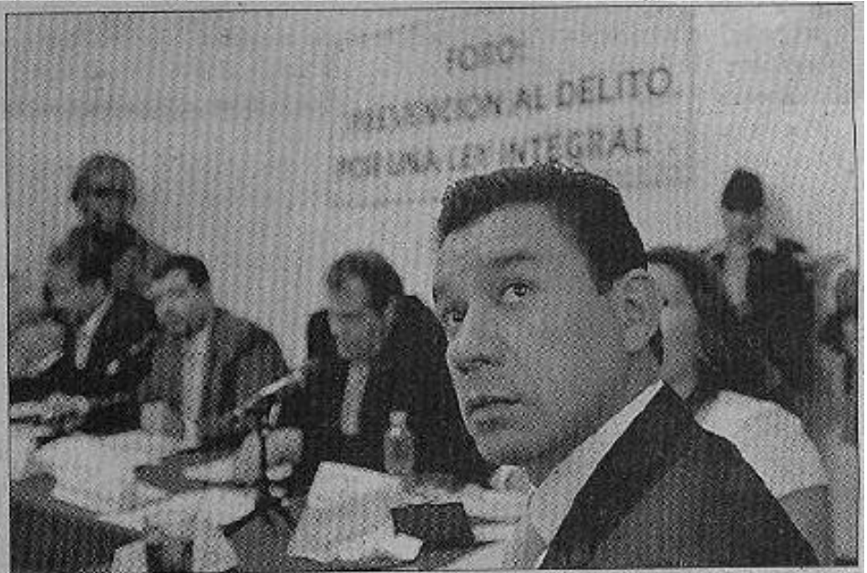
» EL JEFE delegacional de Iztapalapa participó en el foro "Prevención del Delito, por una ley integral en el Distrito Federal".