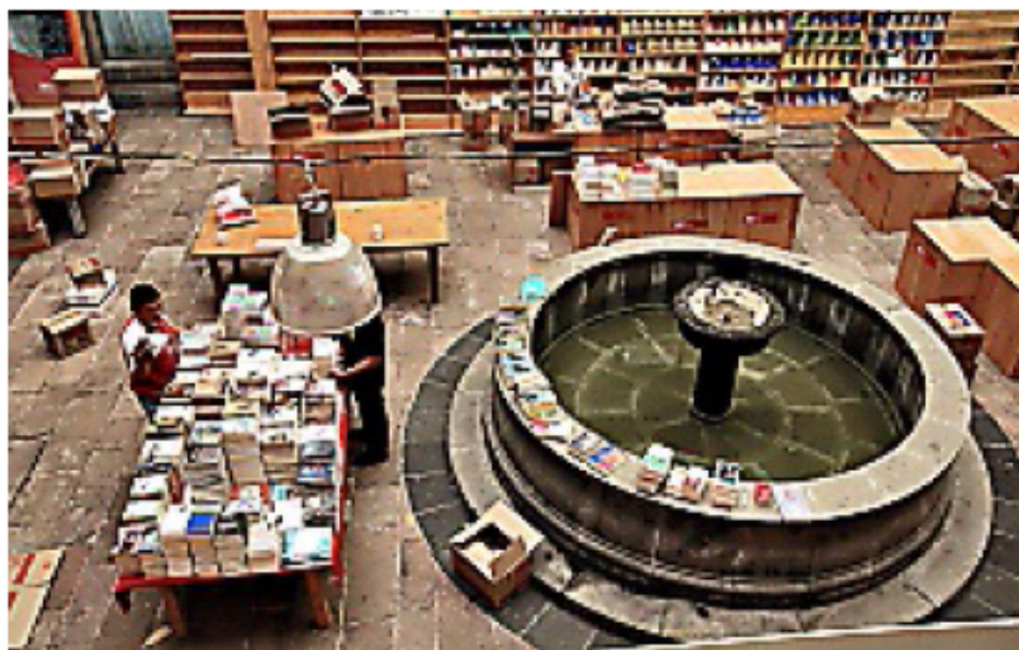
> Unas 600 editoriales participan en la 34 edición de la FIL de Minería.