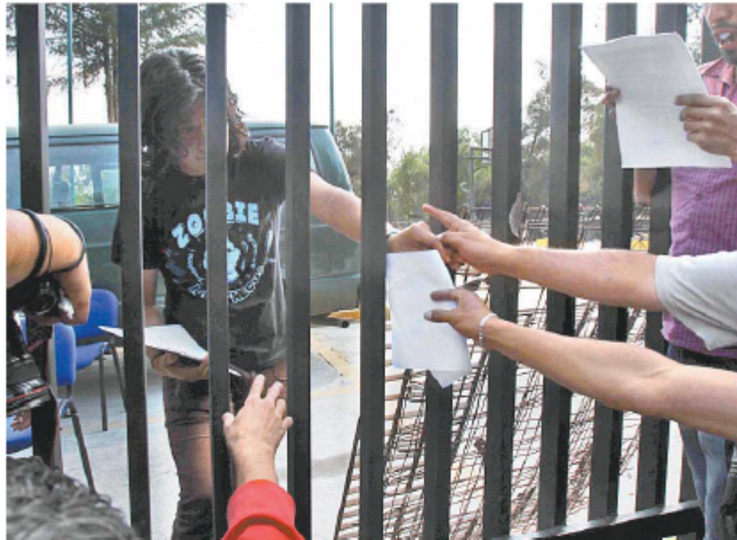
Señalan que los discursos en los dos conflictos son parecidos.