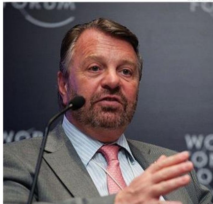
Jorge G. Castañeda Gutman.

Brotan nuevos nombres para la Secretaría de Educación Pública en el próximo gabinete de Enrique Peña Nieto, los cuales se dan a conocer sin la menor intención dolosa, simplemente por el deseo de que el nombre del futuro secretario se apremie y se ventile públicamente, para bien de este ámbito político que requiere tratamiento especial.