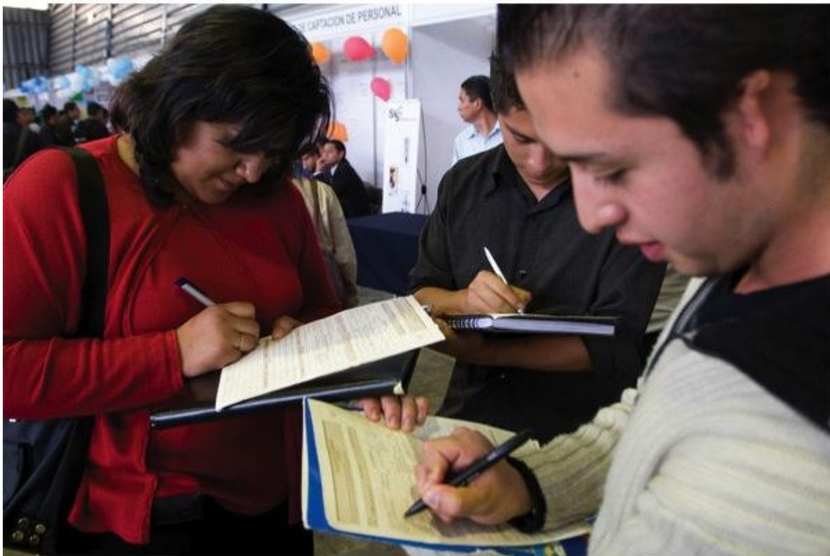
Los estudiantes ignoran las carreras técnicas en favor de otras relacionadas con la salud, humanidades o ciencias sociales, pero éstas presentan mayor competencia laboral.

Apenas uno de cada seis estudiantes de educación superior en México está inscrito en alguna de las instituciones del sistema de educación tecnológico, de acuerdo con datos de la propia Subsecretaría de Educación Superior.