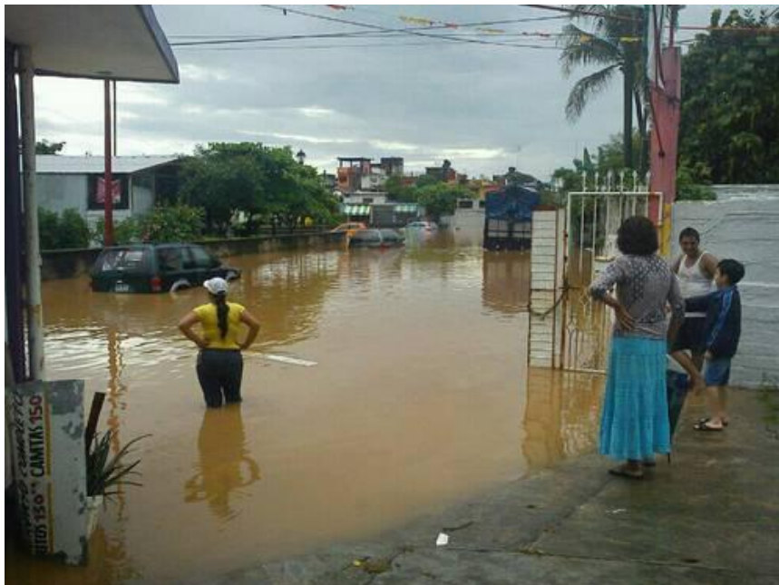
La tormenta Ernesto provocó vientos y lluvias que inundaron al menos 100 casas del municipio de Agua Dulce, en el sur de Veracruz