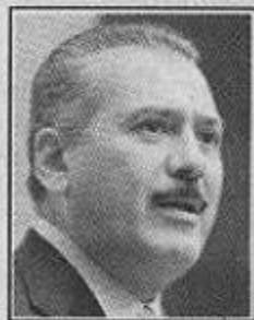
MANLIO F. BELTRONES

del PRI en la próxima Legislatura enviaron mensajes a las fuerzas políticas representadas en el Congreso de la Unión. Manlio Fabio Beltrones , el nuevo líder de la bancada en San Lázaro, y Emilio Gamboa , próximo coordinador en el Senado, pusieron en la mesa el tema de los equilibrios, con el conocimiento de que su partido no tiene la mayoría. Sin embargo, no será blanco de chantajes políticos, dijeron. Enrique Peña Nieto estaba de lo más contento, con los mensajes y la presencia de los nuevos liderazgos. "Seré el presidente de los mexicanos a partir del primero de diciembre", soltó frente a los suyos.