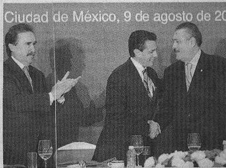
Tuvieron una comida con Peña Nieto en un restaurante capitalino.

Aseguran que solo esperan la designación de sus contrapartes para iniciar el diálogo