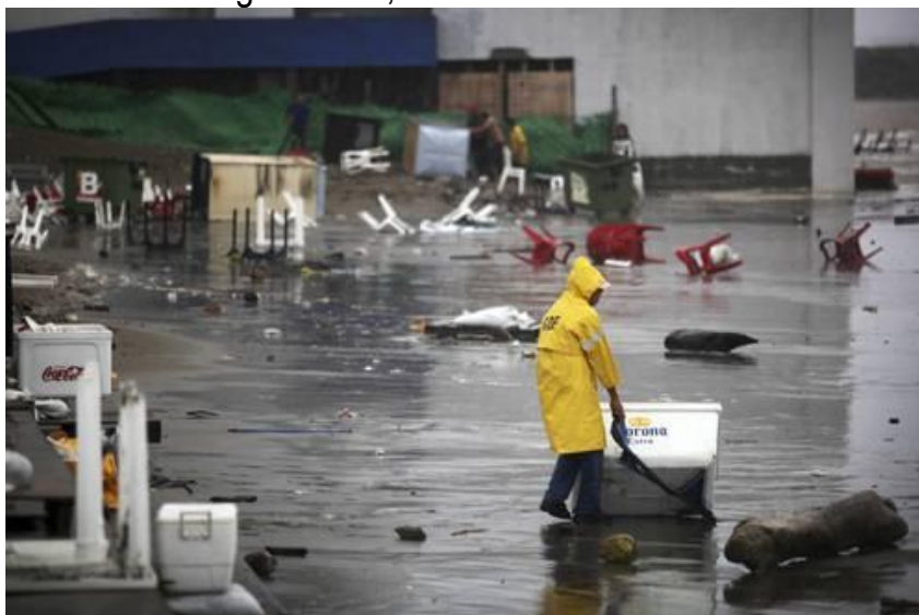
Comerciantes en las playas perdieron mercancías, mobiliario y puestos