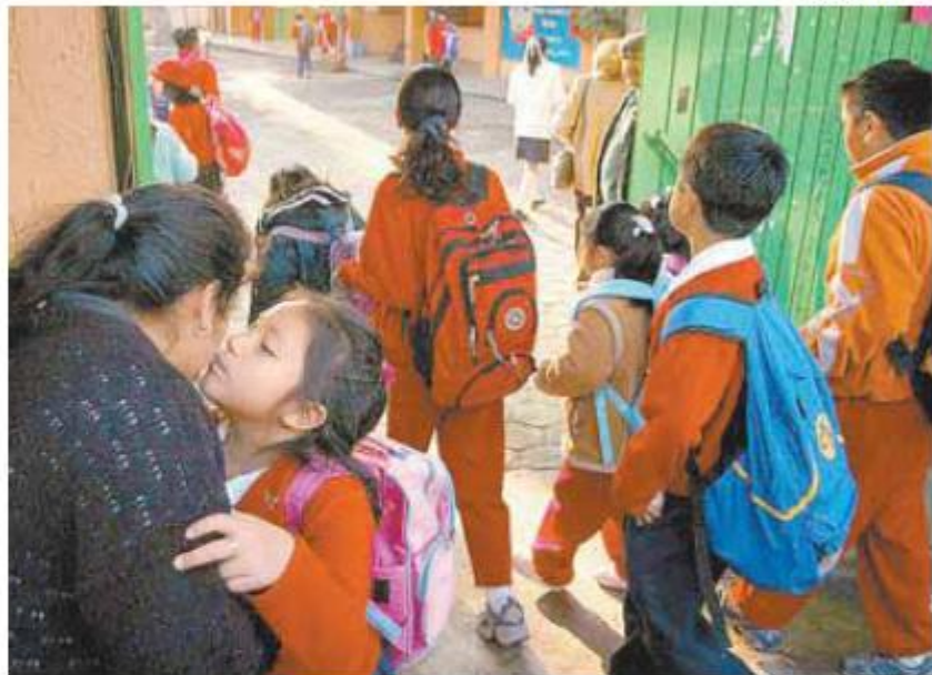
No precisaron los motivos del abandono de aulas.

Durante su ponencia frente a ejecutivos de American Express, expuso que México ha pasado por diferentes etapas en ma-