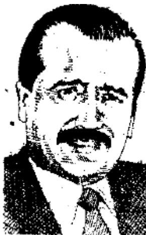
José Ángel Córdova.