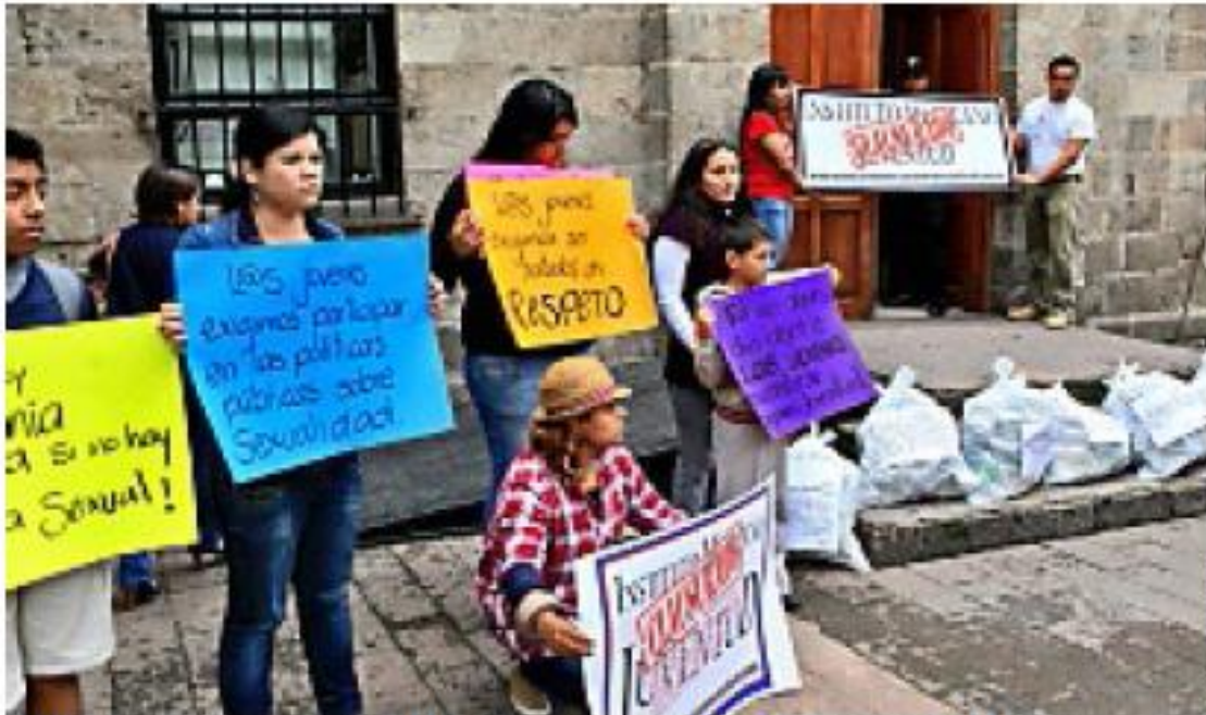
> Organizaciones juveniles clausuraron simbólicamente el Imjuve.