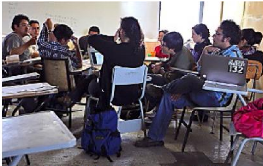
Por día Urda pilieta

Definen prioridades #YoSoy132 acordó seis temas para el contrainforme del 1 de septiembre. PÁGINA 6