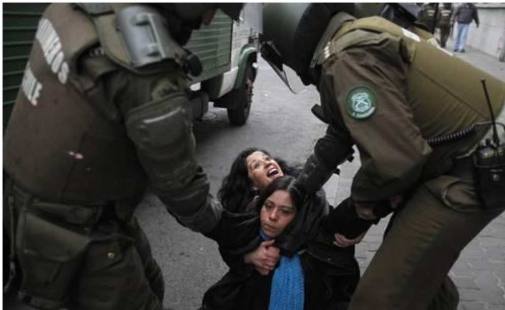
Madres de familia durante una protesta de estudiantes, ayer en Santiago.

ENRIQUE GUTIÉRREZ, Corresponsal y agencias