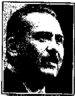
MANLIO F. BELTRONES

A LOS NUEVOS líderes parlamentarios en San Lázaro, Manlio Fabio Beltrones , del PRI; Luis Alberto Villarreal , del PAN, y Silvano Aureoles , del PRD, les tocará evaluar si valió la pena el gasto de más de 100 millones de pesos para el tablero electrónico y las pantallas en las curules en el salón de plenos. Los nuevos diputados contarán con más facilidades para realizar sus tareas sin excusas, nos comentan. Por lo pronto, el secretario de Servicios Parlamentarios,