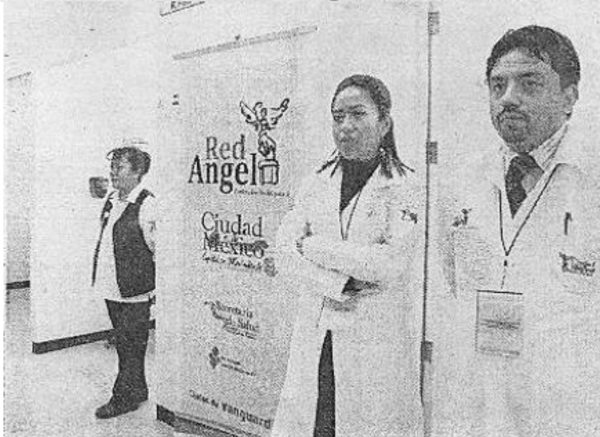
A estos lugares podrán acudir aquellos que cuentan con Seguro Popular y en caso de no tenerlo, se les pedirá que se afilien para poder realizar la revisión a los menores

Las estaciones San Lázaro, Tacubaya, Mixcoac, Zaragoza, Pantitlán, El Rosario, Tasqueña cuentan con clínicas donde se realizará el examen médico