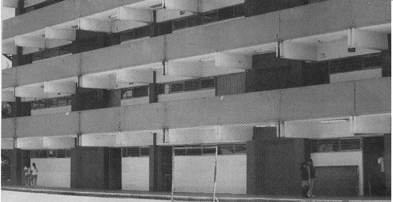
TEMPORAL. El deportivo Salvador Allende ubicado en la unidad habitacional Vicente Guerrero, en Iztapalapa, fue habilitado para albergar en las últimas semanas a los alumnos de la escuela República de Madagascar