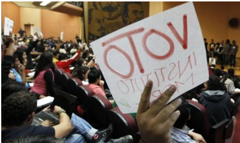
ASPECTO DE LA QUINTA ASAMBLEA NACIONAL INTERUNIVERSITARIA DEL MOVIMIENTO #YoSoy132, CELEBRADA EN LA FACULTAD DE CIENCIAS DE LA UNIVERSIDAD NACIONAL AUTÓNOMA DE MÉXICO.

• Las prácticas ilícitas “alteraron la esencia del sufragio libre”, señala en su pronunciamiento