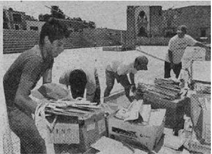
PROCESO. El reciclaje arranca con la separación del material editorial que ya no será utilizado por los escolares.

El programa se aplicó por primera vez en 2010, cuando se recabaron 23 toneladas de libros de texto y para 2011 esa cifra se incrementó a 70 toneladas. ■