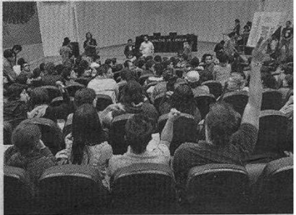
La asamblea se realizó en la Facultad de Ciencias de la UNAM.

Argumentaron que previo a la jornada electoral se documentó compra y coacción del voto, además de manipulación mediática para favorecer al priista.