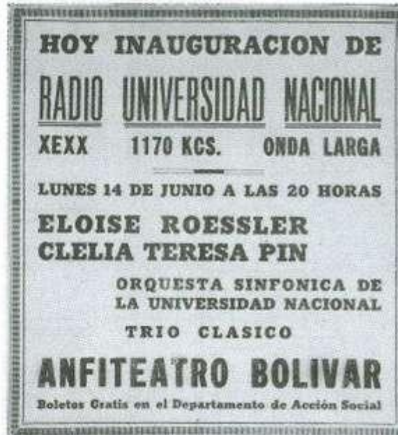
Cartel de inauguración, en 1937.