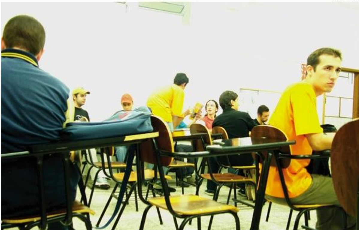
Hoy en día una población universitaria diversa pone en duda la eficacia de los viejos métodos de enseñanza.

Todo ello fue puesto en tela de duda, habida cuenta de que era apremiante hacer algo práctico para mejorar el aprendizaje de los alumnos, más aún, había que lograr la unidad entre los objetivos educativos, los métodos de enseñanza y la evaluación. El afán consistía entonces en engendrar una enseñanza innovadora, y así, sin dejar de apoyar el desenvolvimiento del profesorado, comenzó a