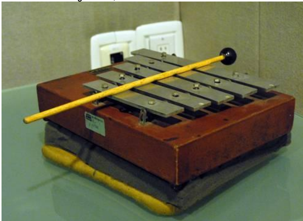
Xilófono para el sonido emblemático de los cortes de identificación de Radio UNAM.