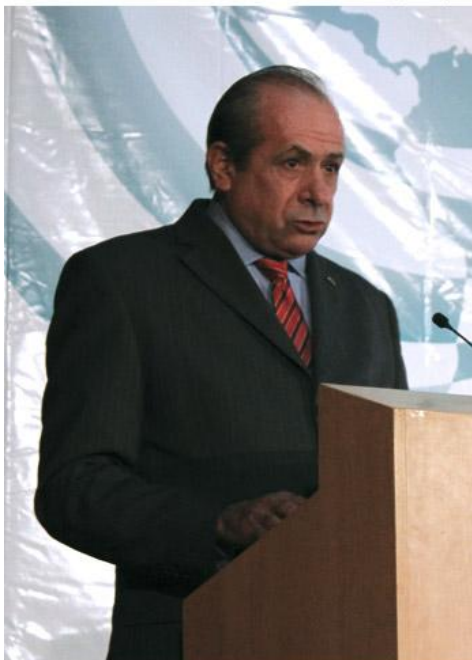
Para el rector de la UAM, Enrique Fernández Fasnacht, se debe promover la reflexión y discusión sobre los desafíos que enfrentan las universidades públicas latinoamericanas.

Promover la reflexión y la discusión sobre la trascendencia de los múltiples desafíos de las universidades públicas en América Latina, es en estos momentos una propuesta necesaria para cumplir con la sociedad en momento cruciales para todos los países en la escena de la educación.