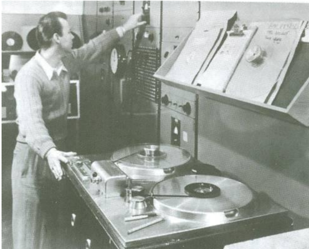
Un aspecto del estudio en 1937.