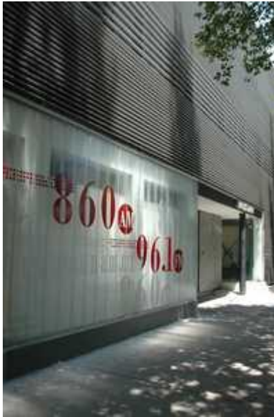
Fachada actual de la estación