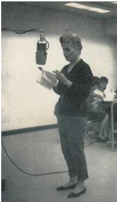
La actriz Ofelia Guilmáin en una transmisión de radioteatro, en 1961

“En la medida que ésta y las demás estaciones universitarias de nuestro país se fortalezcan, iremos teniendo mayores y mejores audiencias, mucho más participativas, porque el contenido generado por las universidades, llevado por un discurso radiofónico, será constructor de una cada vez mayor comunidad de oyentes, no tengo duda. Entonces, podremos pensar en audiencias más críticas, más libres, más inquietas.”