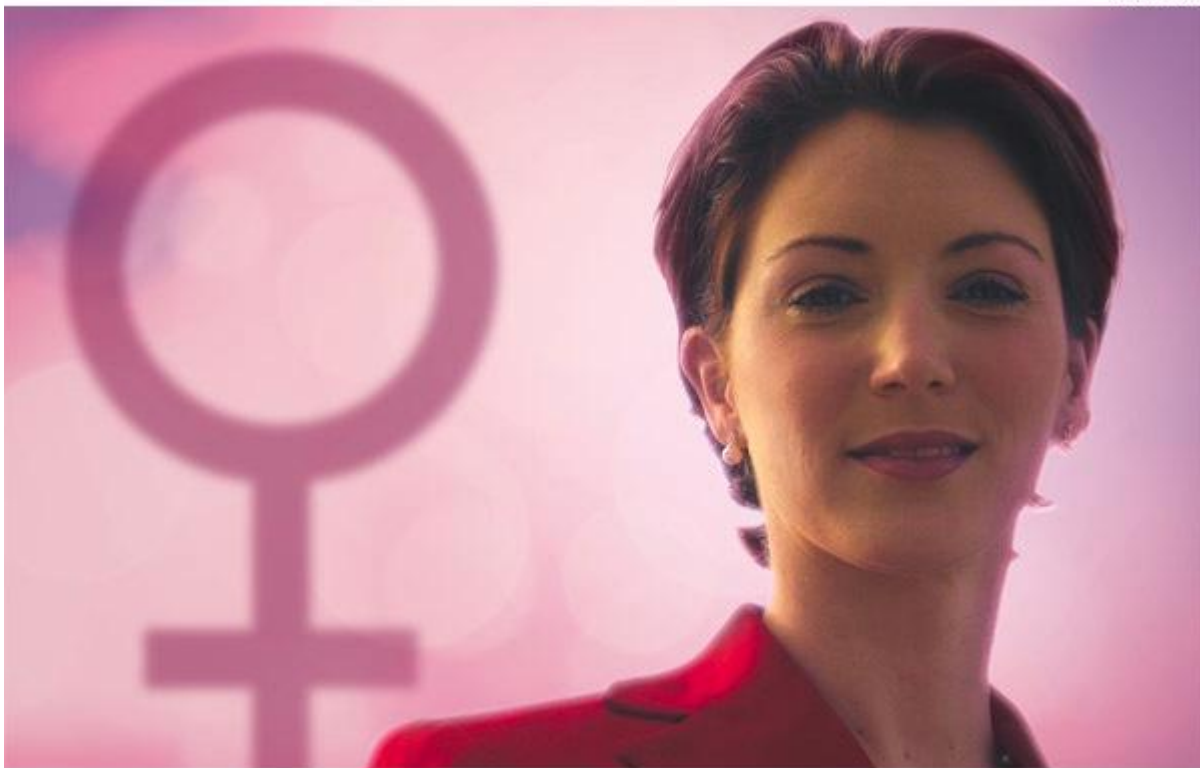
Las mujeres asumen el liderazgo en las diferentes actividades de la vida universitaria con un crecimiento exponencial.

Y son las propias mujeres las que hablan de sus logros, de sus alcances, pero sobre todo del papel medular que han jugado en la transformación del rostro de la educación superior, de la ciencia, la investigación, las humanidades y las artes del país.