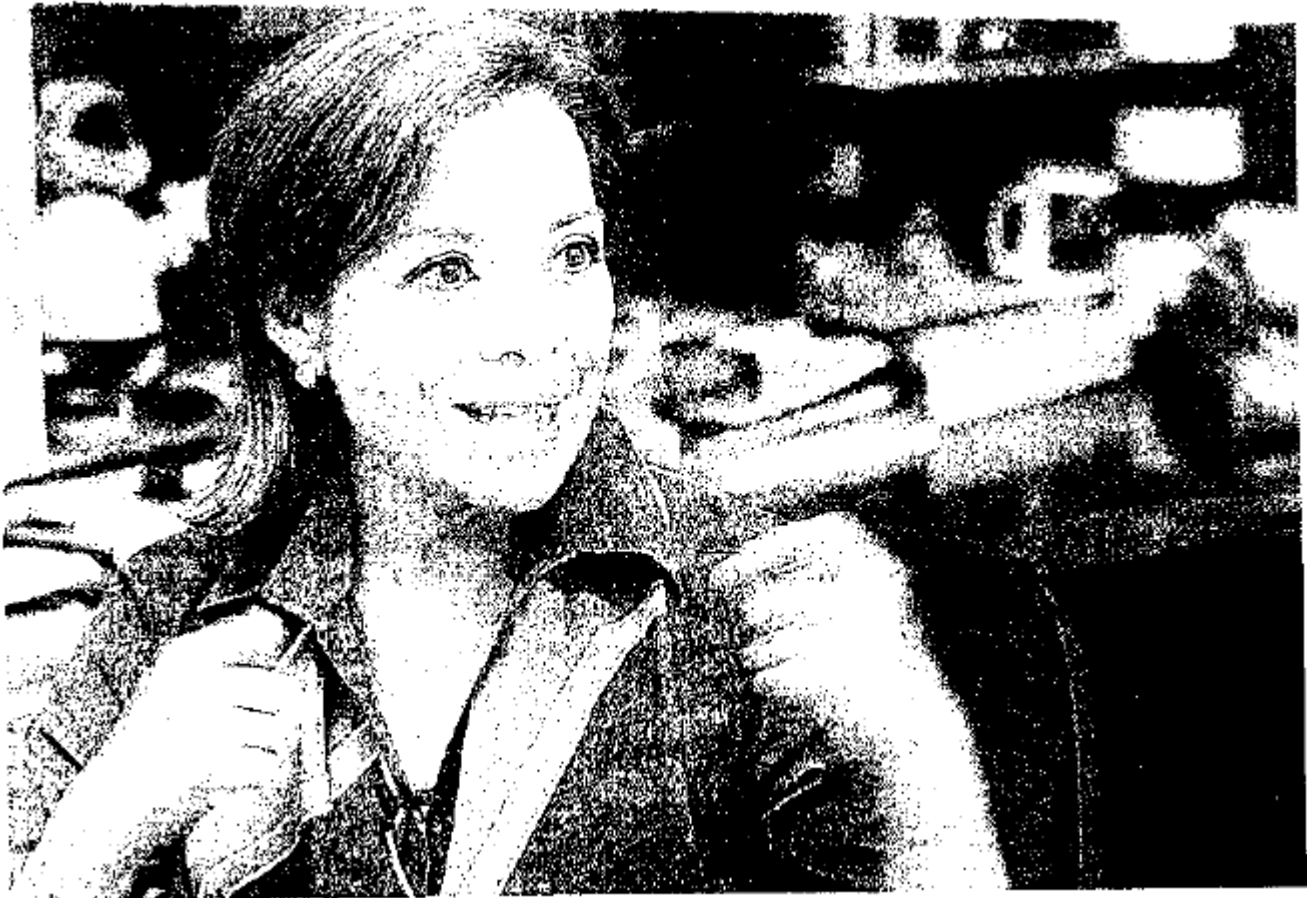
La candidata panista durante la charla en el programa El asalto a la razón .