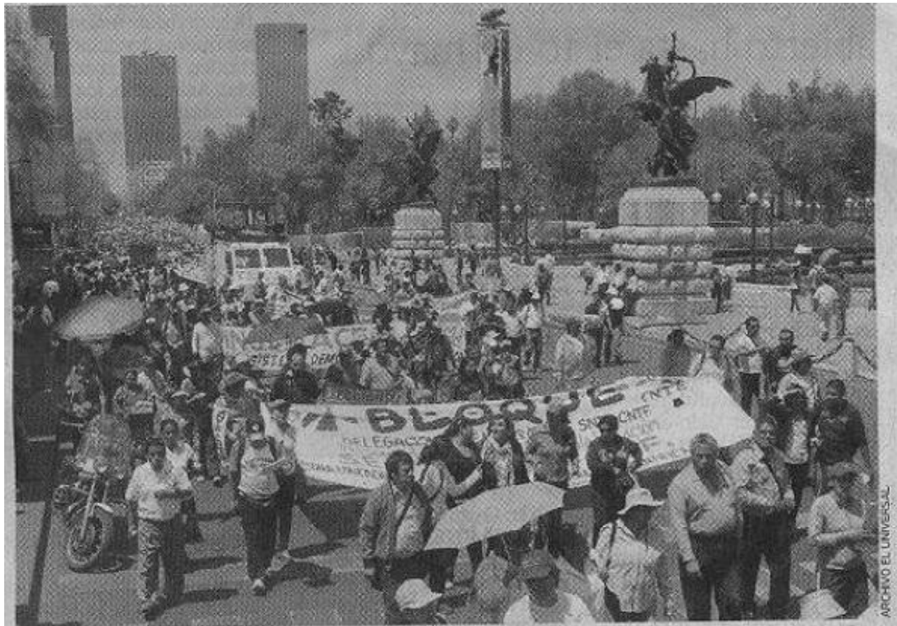
PROTESTA. Integrantes de la CNTE afirman que la prueba ENLACE no ha ayudado a mejorar la calidad educativa el país. En imagen de marzo pasado, maestros marchan contra la Evaluación Universal