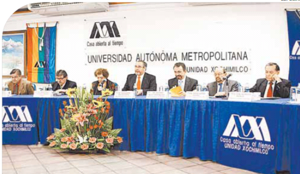
ESPECIAL Especialistas y científicos reflexionaron en torno a la trayectoria del SNI.