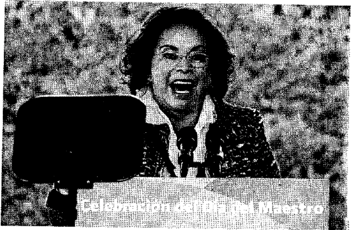
DISCURSO. La dirigente sindical Eiba Esther Gordillo, ayer en Los Pinos