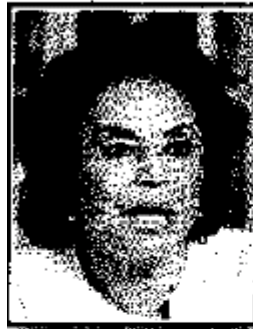
ELBA ESTHER GORDILLO

EL ROSTRO del presidente Felipe Calderón en dureció con el discurso de la profesora Elba Esther Gordillo , pero le dejó que se moviera y que rezotara a sus anchas en la residencia de Los Pinos. La presidenta del poderoso Sindicato Nacional de Trabajadores de la Educación dio un fuerte discurso con motivo del Día del Maestro, que le permitió cobrar viejas cuentas con la ahora candidata presidencial del PAN, Josefina Vázquez Mota .