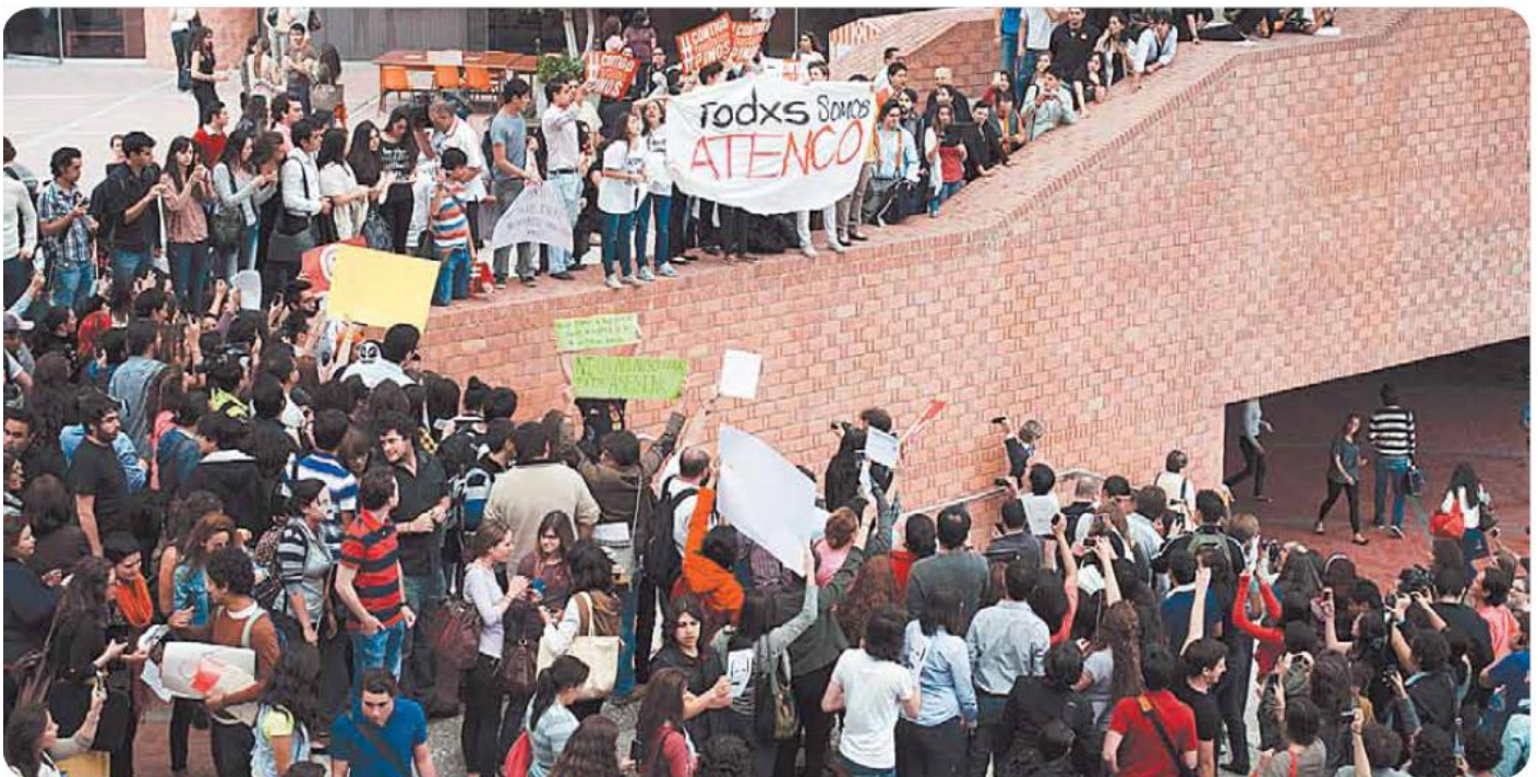
Estudiantes de la Universidad Iberoamericana durante la visita de Enrique Peña Nieto.