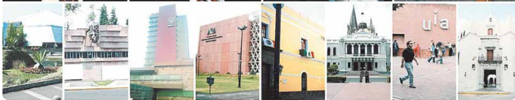
CANDIDATOS: ANUIES/ UNIVERSIDADES: ESPECIAL