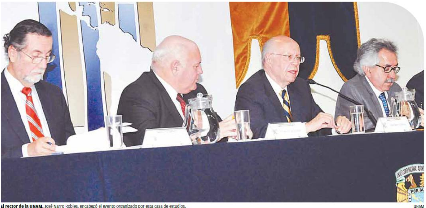
El rector de la UNAM, José Narro Robles, encabezó el evento organizado por esta casa de estudios.

Las instituciones de educación superior en América Latina y el Caribe están lo suficientemente maduras para emprender la construcción de una verdadera carretera del conocimiento en la región, una auténtica autopista para la movilidad de nuestros estudiantes, aseguró el rector de la UNAM, José Narro Robles.