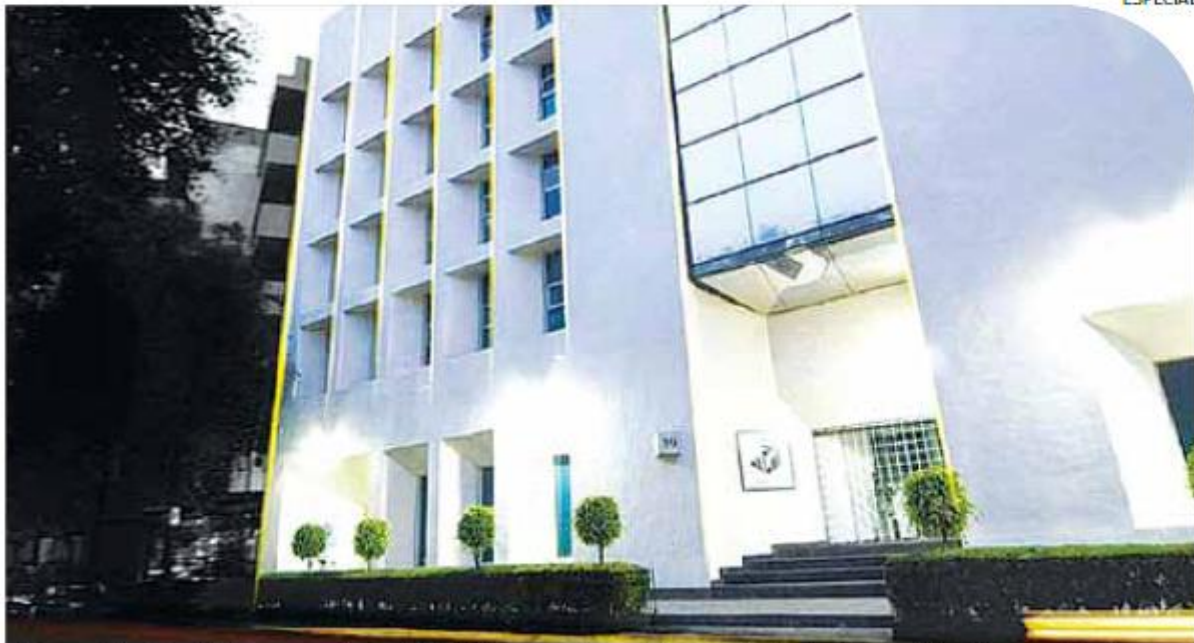
El Ceneval ha atendido las propuestas de la ANUIES expresadas en el documento Evaluación, certificación y acreditación .

La Asamblea General de la ANUIES expresó, en 2008, su postura dentro de la evaluación del sistema educativo nacional. Al presentar Evaluación, certificación y acreditación en la educación superior de México puso en la palestra algunas acciones necesarias para mejorar la calidad educativa, en particular la de la educación superior. El documento destacaba, entre otros aspectos, la necesidad de conceder mayor relevancia a la evaluación de los aprendizajes, establecer una entidad evaluadora en cada institución de educación superior, impulsar la formación de profesionales en materia de evaluación educativa y efectuar una reforma en el proceso para otorgar el Reconocimiento de Validez Oficial de Estudios. Dedicaba un apartado al Ceneval en el que se mencionaban sus logros, pero también limitaciones y retos. Se incluyeron propuestas para asegurar el logro de sus objetivos, los cuales fueron trazados por la misma Asociación, hace casi dos décadas, cuando recomendó su creación. De entre las observaciones antes mencionadas destacan las siguientes: