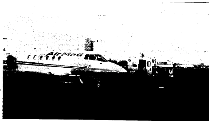
TRATAMIENTO. En esta aeronave de transporte médico especializado fue llevado el secretario de Educación a un hospital de Estados Unidos. Se prevé que este lunes se hará oficial su retiro al frente de la SEP.

La SEP informó que Alonso Lujambio ingresó en una segunda fase de tratamiento contra el mieloma múltiple que lo afecta