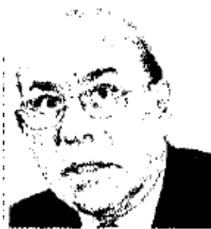
JOSÉ ÁNGEL GURRIA

está en el escritorio del presidente Felipe Calderón y en las oficinas de 11 secretarios de Estado. El secretario general de la OCDE, José Ángel Gurria , estuvo el lunes con el jefe del Ejecutivo para hablar de las reformas estructurales que requiere México, como la fiscal y la laboral. "Perspectivas OCDE: México, reformas para el cambio", se llama el texto que también fue entregado a los titulares de Pemex, de la