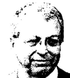
MANUEL CAMACHO SOLÍS

COMO SI hicieran falta nombres de aspirantes a la