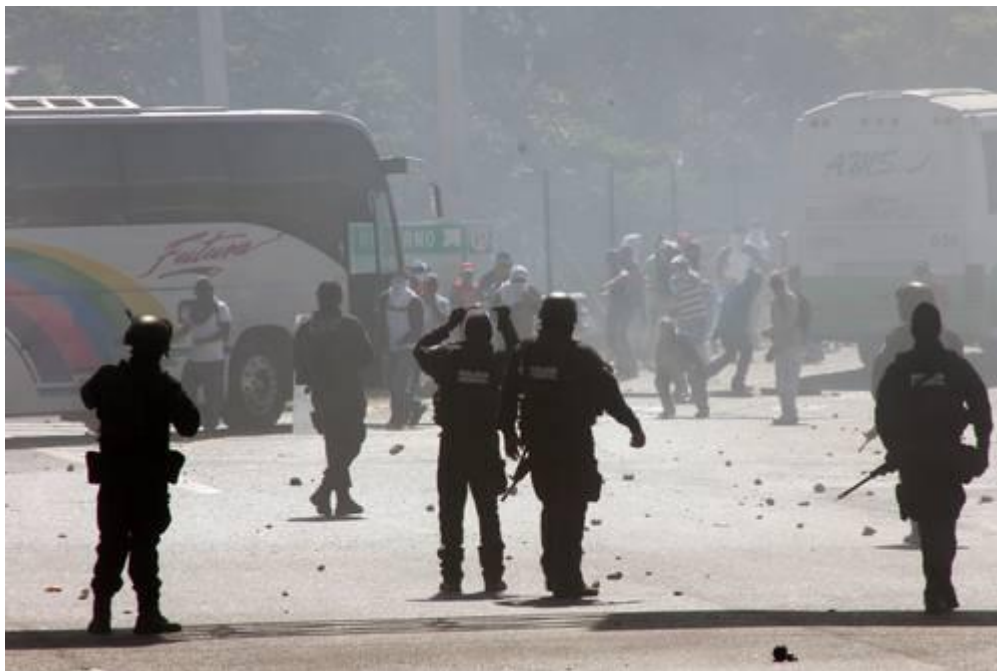
IMÁGENES DEL DESALOJO DE NORMALISTAS DE AYOTZINAPA EL PASADO 12 DE DICIEMBRE

Por error, Aguirre anuncia otra vez la muerte del empleado de gasolinera