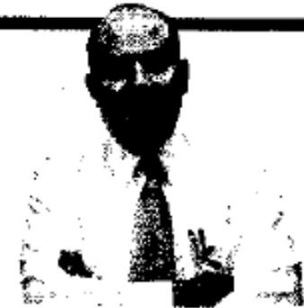
JULIO BRITO A.

Con una inversión de más de 179 millones de pesos, el nuevo edificio ofrecerá más de 75 mil consultas