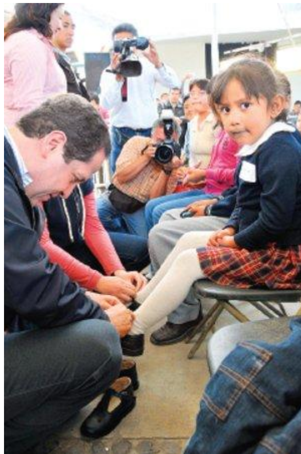
AYUDA. ERUVIEL ÁVILA ENTREGÓ APOYOS A POBLADORES DE ATLAUTLA

ECATZINGO, Méx.— Después de mes y medio de que inició su gestión, el gobernador del Estado de México, Eruviel Ávila Villegas, dio a conocer de manera pública, a través del portal del gobierno mexiquense, los 6 mil compromisos de campaña que firmó ante notario público.