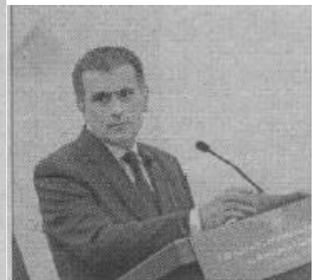
El titular de la SEP ingresó al hospital con una afección renal severa.

Una de sus últimas presentaciones fue en la reunión con los secretarios de Educación estatales, con quienes acordó crear el primer diagnóstico sobre índices de violencia en el sistema educativo del país y rediseñar protocolos de seguridad en escuelas y universidades ante la situación que aqueja al país.