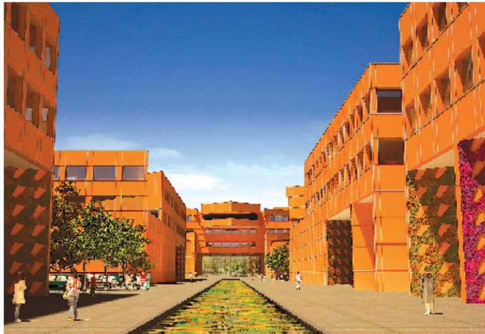
Las universidades públicas debemos unimos y no dar por sentado lo que sucede en el país: Fernández Fassnacht.

Se debe regresar a los orígenes: las universidades fueron concebidas para formar gente competente con capacidad crítica, profesio-