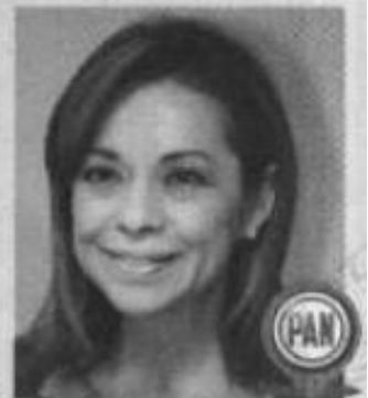
JOSEFINA VÁZQUEZ MOTA

El senador con licencia estará hoy y todo el fin de semana en Michoacán en los días de campaña de los candidatos del PAN en ese estado, como es el caso de Luisa María Calderón y Marko Cortés, abanderado a la alcaldía de Morelia.