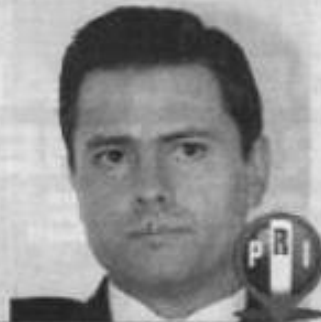
ENRIQUE PEÑA NIETO

Consulta en nuestro sitio de internet el día a día de los aspirantes a la candidatura presidencial.