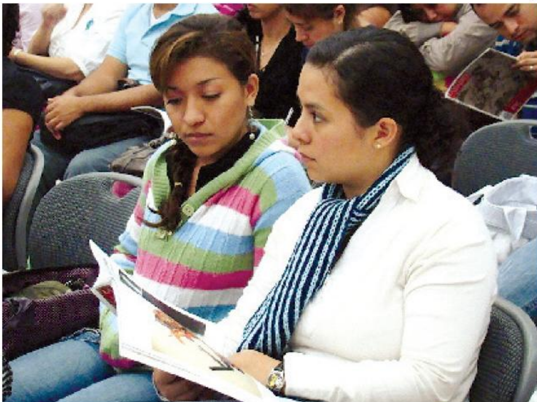
Los jóvenes tiene un vocabulario que fluctúa entre 300 y mil 500 palabras, y se debe tener en cuenta que el idioma español posee aproximadamente 80 mil palabras